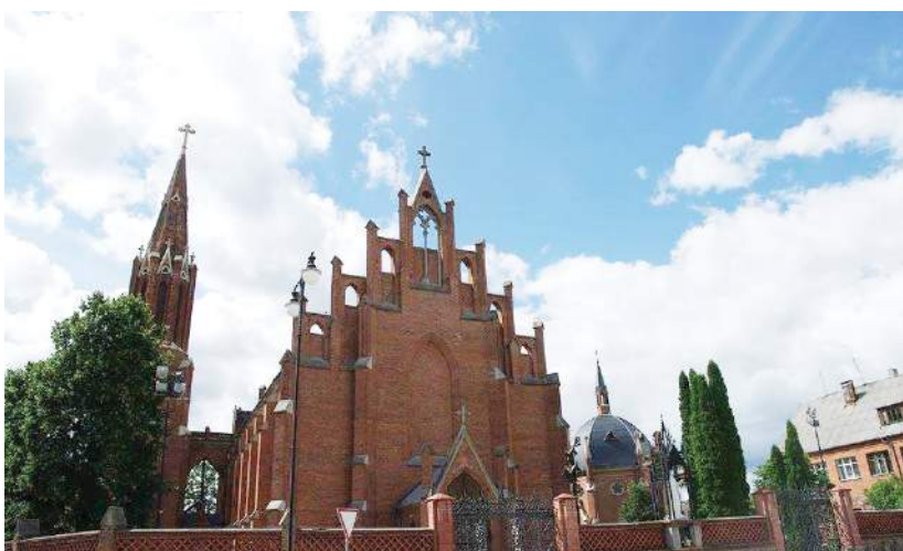
Šv. Mato bažnyčia kelia daugelio rokiškėnų pasidžiavimą.

Atėjus pavasariui, Rokiškį užplūdo turistai. Vieni, nusprendę praleisti savaitgalį kelionėje, ieškojo gražaus Lietuvos kampelio, o kiti aplankyti Rokiškio atvyko net iš užsienio. Kyla klausimas, kuo Rokiškis patrauklus šiems smalsuoliams?