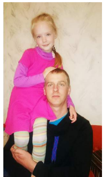
Mažoji Inos dukrytė nepamiršta pasveikinti savo tėčio.

Natūralu, kad Tėvo dienos šventė niekada nebus tokia jautri kaip Motinos diena. Tačiau matome, kad ir tėvams, ir vaikams ji yra ne ką mažiau svarbi. Tėvo diena lietuviams tampa vis artimesnė ir vis daugiau mylimų mūsų tėvelių būna pasveikinti.