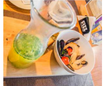
Karališka „Rokiškio žuvinė“.

Pietūs penkiems žmonėms kainavo 20,95 euro. Svarbiausia tai, jog kiekvienas gavo ko norėjo.