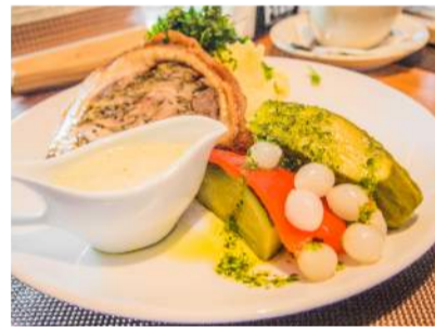
Itališkas kiaulienos vyniotinis „Porchetta“.

Po šio lietuviško patiekalo atėjo laikas itališkam – makaronams su vištiena ir grybais (3,69 euro). Maloniai nustebino tai, jog dar buvo galima pasirinkti net pačių makaronų formą. Čia jau tikra privilegija. Puiki įžanga lėmė, jog šių makaronų paskutinis kąsnis buvo toks pats. Visą kulinarinį tautų katilo skonį nuskalavo pomidorų sultys (0,79 euro).