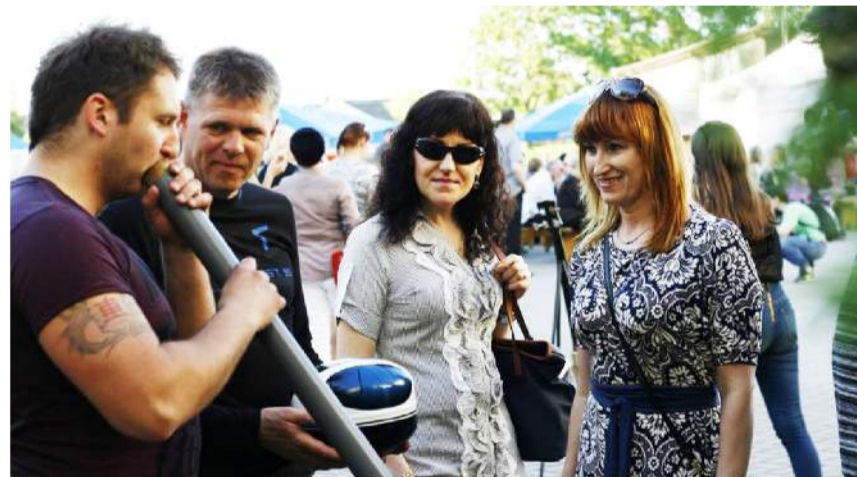
Išbandomi netradiciniai muzikos instrumentai.