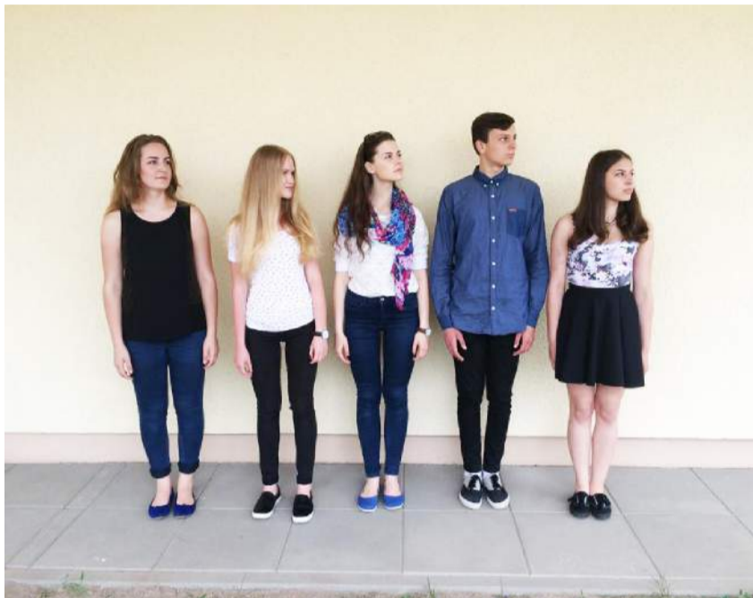
„Iššūkis ant ratų“ iniciatyvinė grupė.