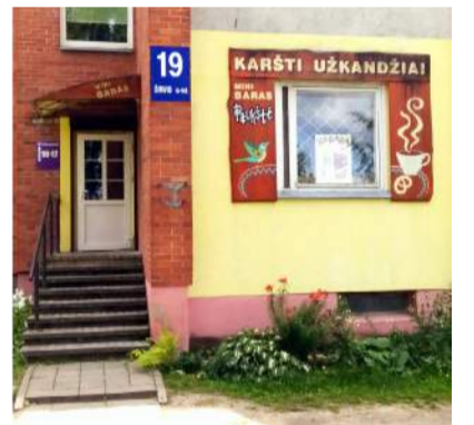
Mini baras „Paukštė“ įsikūręs šalia Juozo Tūbelio progimnazijos.

Moteriškiems skonio receptoriams puikiai tiko „Panini“ su daržovėmis (1,30 euro) ir „Focaccia“ su daržovėmis (1,30 euro). Nors ir vegetariškas maistas, bet skoniui tikrai nenusileido vyriškiems užkandžiams. Skanus