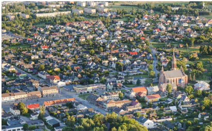
Rokiškis iš paukščio skrydžio.