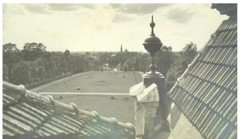
Rokiškio panorama (vaizdas į vakarus nuo dvaro stogo 1931 – 1932 m.).

Rokiškio krašto muziejaus archyvo nuotr. (RKM-252365)