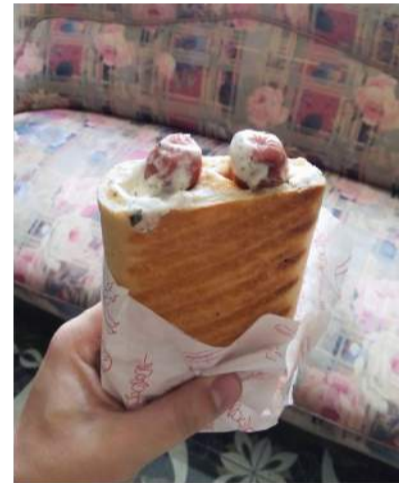
Dvigubas prancūziškas dešrainis.

Puiki ir minkšta bandelė skoniui pridėjo naujų pojūčių. Jubilatas dorėjo jį kosminiu greičiu. Iš tokių apsakų nereikėjo net klausyti ar skanu. Tai buvo puiki saldaus torto alternatyva. Jam gerai, o mums dar geriau.