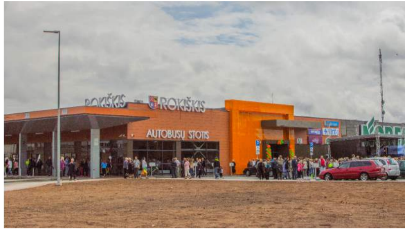
„Norfa XXL“ Rokiškyje yra jau ketvirtas rajone UAB „Norfos mažmena“ prekybos centras.

Džiugu, kad naujoji Rokiškio autobusų stotis miestui nekainavo nei euro. Savivaldybė dalį autobusų stoties sklypo perdavė investuotojui, kuris mainais suprojektavo ir pastatė naują pastatą. Įmonė „Rivona“, buvusios autobusų stoties teritorijoje, pastatė naują prekybos centrą „Norfa XXL“. Tame pačiame pastate įsikūrė ir Rokiškio autobusų stotis. Ji užima 350 kv. m plotą. Čia įrengti aštuoni peronai: septyni - išvykimo ir vienas - atvykimo.