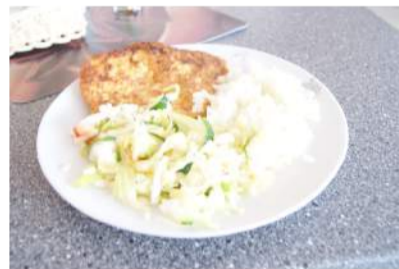
Vištienos kepsnys su ryžiais bei gaviomis salotomis.