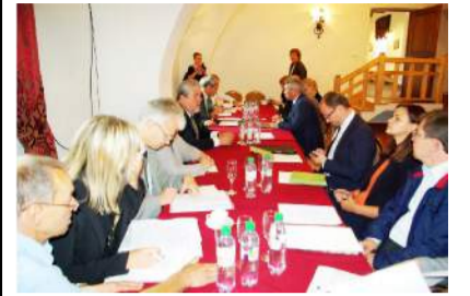
Pasitarime buvo aptartos traukinio maršruto Klaipėda – Rokiškis – Daugpilis galimybės.