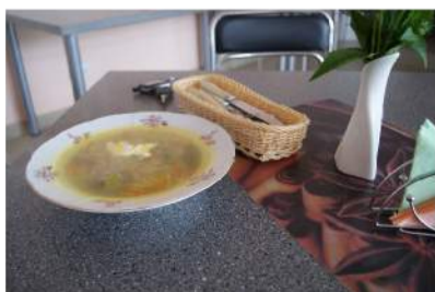
Sriubos lėškė kainuoja 60 euro centų.