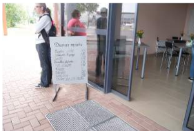
Dienos meniu galima pamatyti jau lauke.