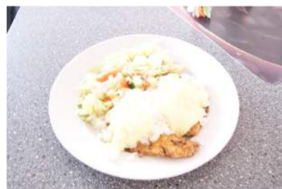
Vištienos kepsnys su sūriu.