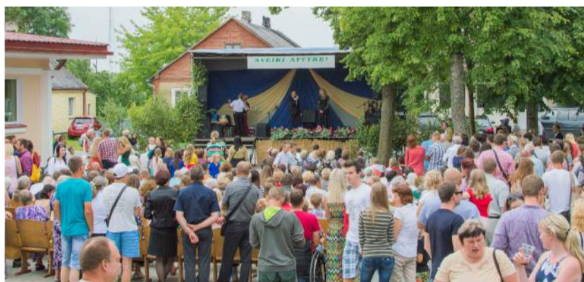
Pandėlyje renginiai vyko net tris dienas.

pasibaigus, apgailestavo, jog kito tokio renginio teks laukti iki kitų metų. Iš ties, Pandėlio sporto šventės organizatoriai bei dalyviai sukūrė puikią nuotaiką ne tik komandoms, bet ir jų sirgaliams. Ypač smagu matyti šeimas su vaikais, kurie net tik palaikė mamą, tėtį ar brolių, bet ir patys žaidė pievelėje. Juk sportinė dvasia užkrečiama!