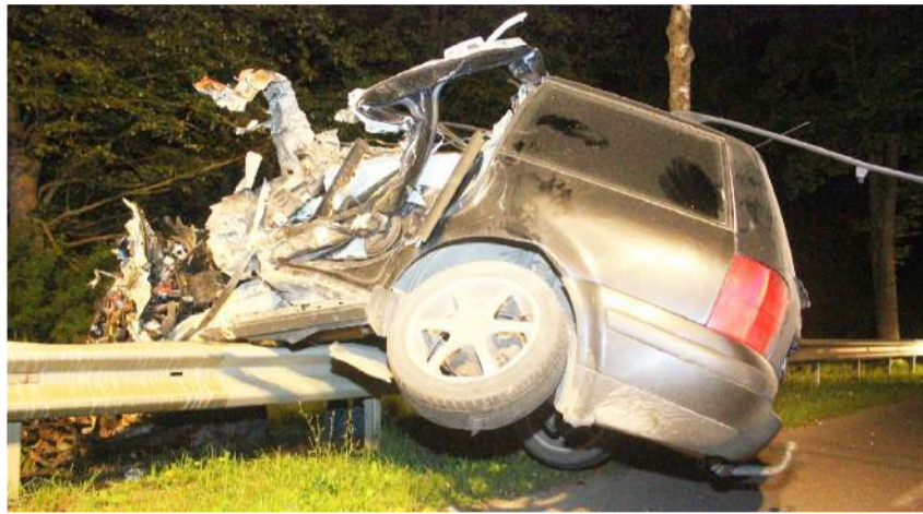
Po avarijos automobilis buvo visiškai sumaitotas.