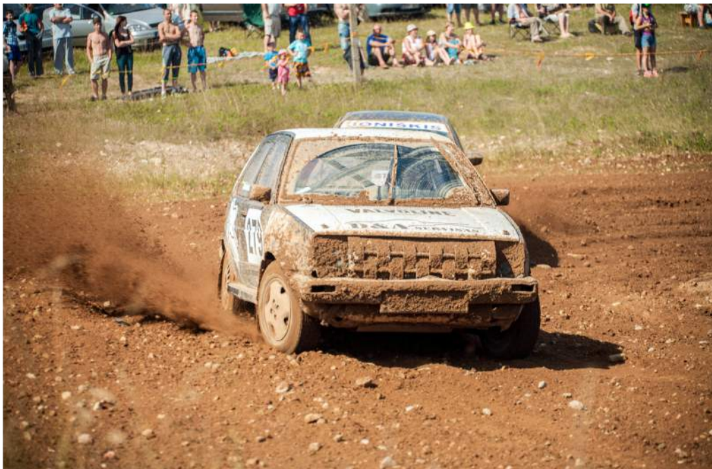
Lenktynėse netrūko įspūdingų akimirų.

Dėl „Šermukšniuko“ taurės kovojo sportininkai, užėmę pirmąsias vietas savo klasėje.