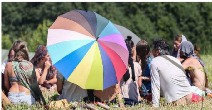
Laikini stovyklautojai jau išvyksta.

Nežinau, ar kada nors taip arti, tokioje mažoje erdvėje, dar pamatysiu tiek „pasaulio“. Šie žmonės, palikę visus materialius dalykus, atvykę čia vieni su kitais dalinasi savo patirtimi, džiaugsmu ir tiesiog būna kartu su vieni kitais ir gamta. Būtų kvaila slėpti, jog jie spinduliuoja išskirtiniu dvasingumu ir draugiškumu. „Rainbow Gathering“ nesibaigia ištisus metus, dabar jis keliasi į Karpatų kalnus.