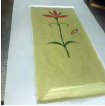
Gyvybės medžio motyvais puoš Obelių langines