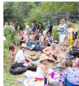
Čia susirinko įvairiausių tautybių žmonės.

sava kultūra ir papročiai. Žmonės dainuoja, šypsosi be priežasties. Mankština, medituoja, užsiimnėja joga ar net meldžiasi saviems Dievams. Ir mums teko sudalyvauti jų apeigose, kurios paliko didžiulį įspūdį. Susirinkę pietauti visi rankomis susikibo į didžiulį ratą, dalindamiesi energija ir skleisdami įvairiausias garsus. Vėliau iškėlė rankas į Saulę ir nusilenkė Žemei. Tai buvo lyg savotiška malda ir padėka. Pasak jų, šis ritualas padeda nurimti. Tai yra kilę iš rytų tikėjimų, persipynę iš įvairių kultūrų papročių ir taikoma čia – hipių judėjime.