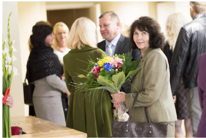
Kultūros centre mokytojus su muzika pasitiko jaunieji mokinukai.