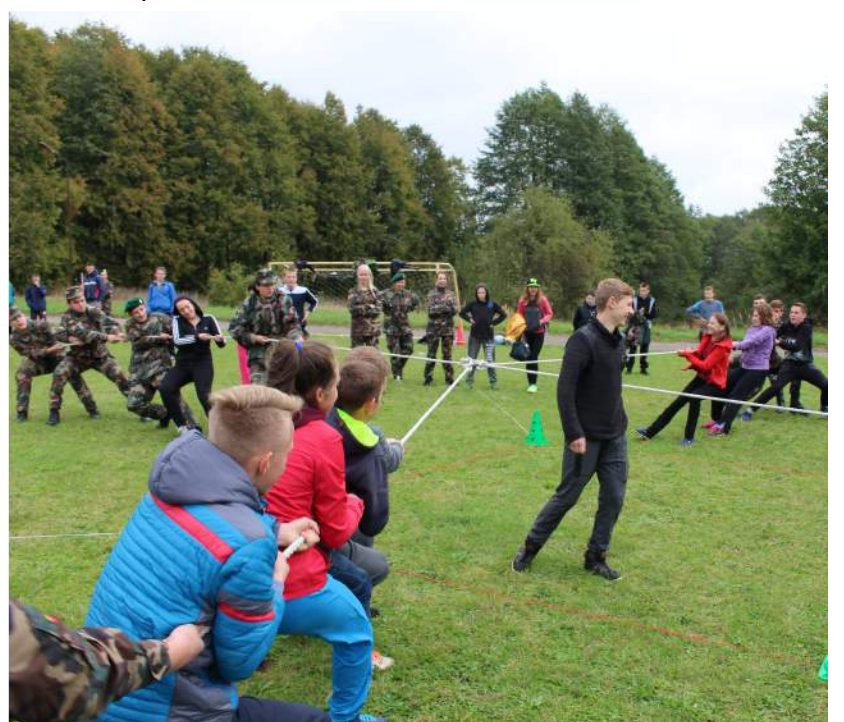
Kitoniškos virvės traukimo rungtis sulaukė didelio susidomėjimo.