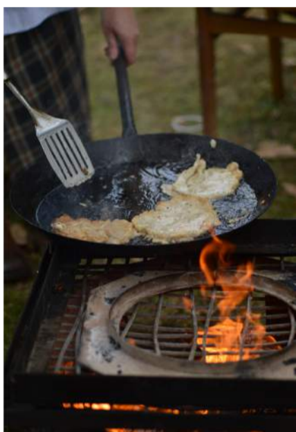
Aikštėje šurmuliavo prekybininkai - buvo galima paskanauti skanių blynų.