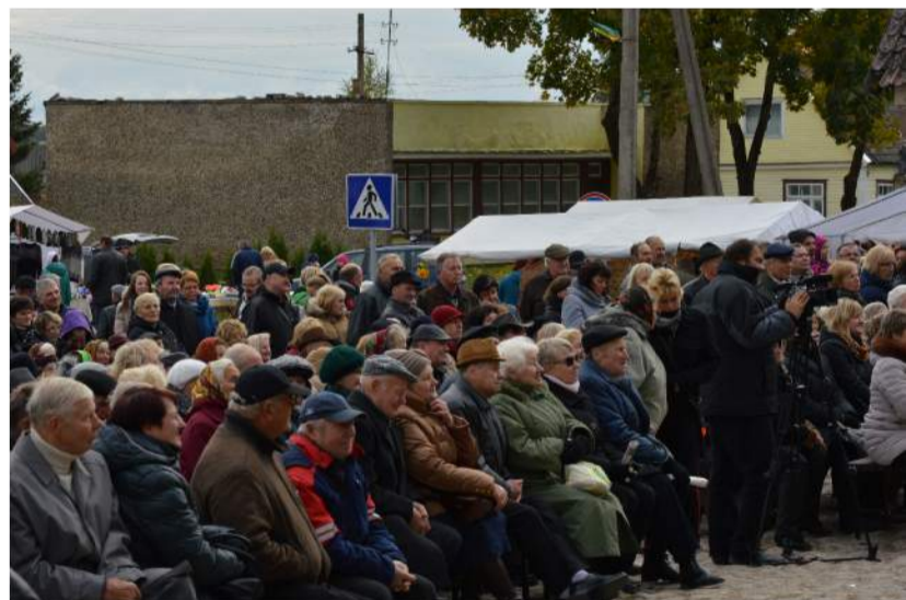
Į centrinę Kamajų aikštę susirinko ne tik daugybę vietinių gyventojų, bet ir svečių.