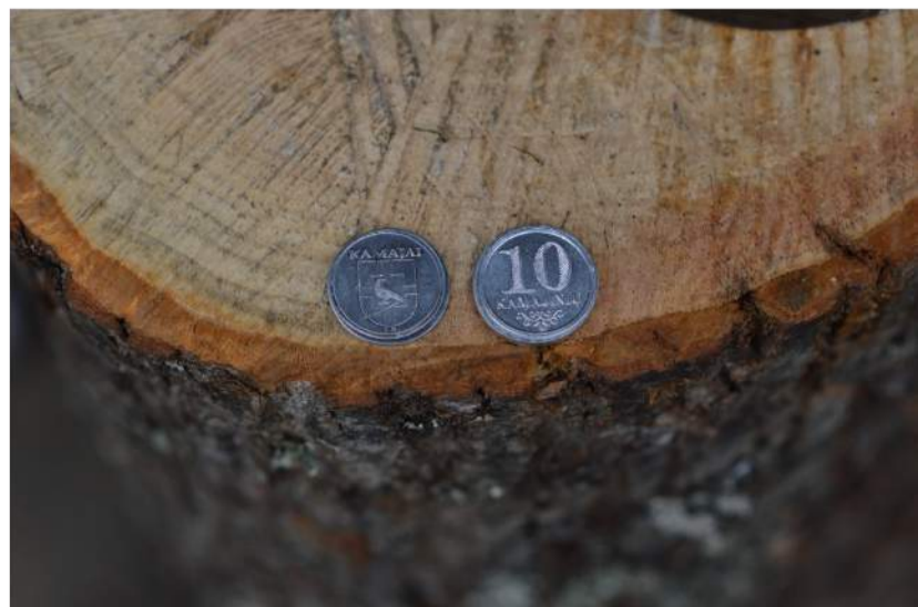
Kamajų respublika turi savo valiutą.