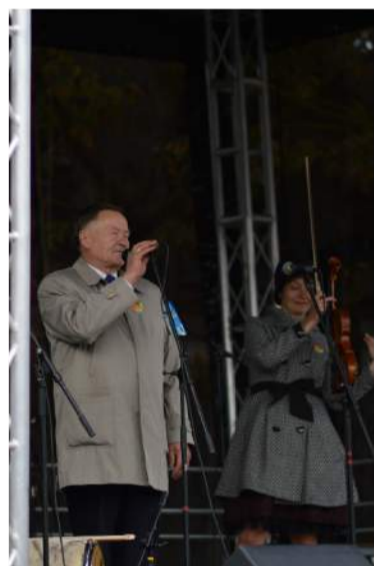
Visus susirinkusius sveikino Kamajų respublikos prezidentas Vytautas Vilyus.