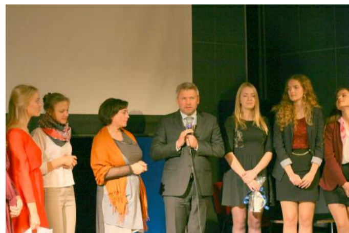
Jaunųjų Lyderių klubą sveikino rajono meras Antanas Vagonis.

Jaunųjų Lyderių klubą su 11-uoju gimtadieniu pasveikino rajono meras Antanas Vagonas bei LR Seimo narys Vytautas Saulis. Klubas susilaukė dar daug partnerių, draugų, rėmėjų ir tėvelių sveikinimų. Jaunųjų Lyderių klubą sveikiname ir mes.