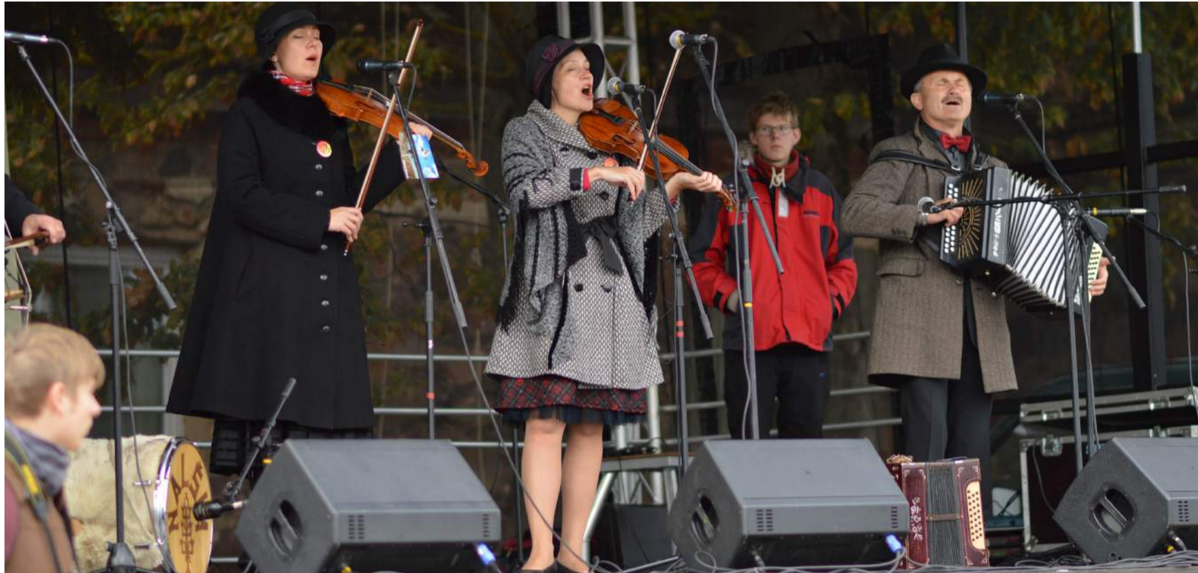
Svečiai linksmai lingavo kartu su muzikantais.

Prausk neprausęs varną, vis tiek ji juoda.