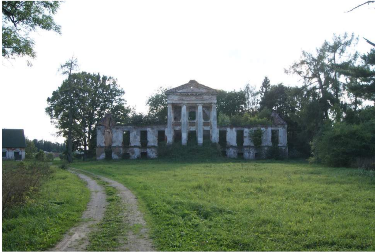
Onušio dvaro griuvėsiai matomi nuo kelio.