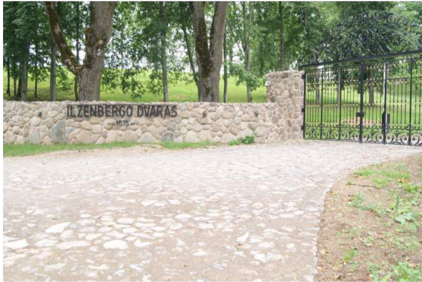
Sutvarkytas Ilzenbergo dvaras lankytojų laukia savaitgaliais.