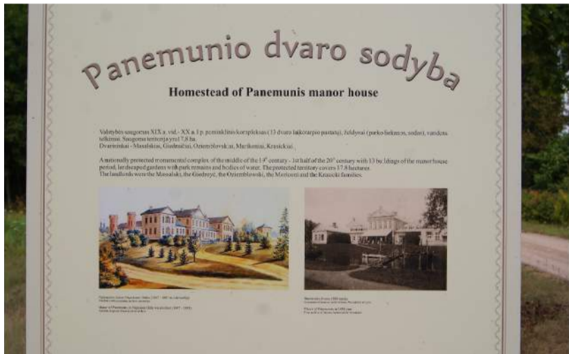
Prie dvarų, įtrauktų į turistams siūlomą maršrutą, įrengti informaciniai stendai.