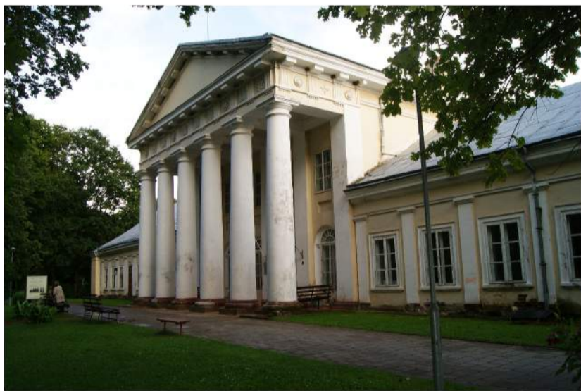
Vasarą Salų dvaras ir jo parkas prispildo muzikos.