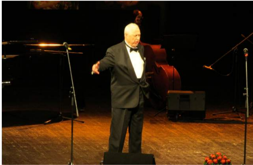
XXI Tarptautinio teatrų festivalio „Interrampa-2015“ ir Rokiškio kultūros centro 69-ojo kūrybinio sezono pristatyme dalyvavo Lietuvos operos grandas Maestro Virgilijus Noreika.

Seniai Rokiškio kultūros centre nemačiau tokio aukšto kultūrinio lygio renginio. E. Druskinas puikiai debiutavo su 69-ojo kūrybinio Rokiškio kultūros centro ir tarptautinio teatrų festivalio „Interrampa-2015“ pristatymu. Matyt, tokio tipo renginių rokiškėnams trūko, nes aš nedažnai girdžiu tokias audringas ovacijas.