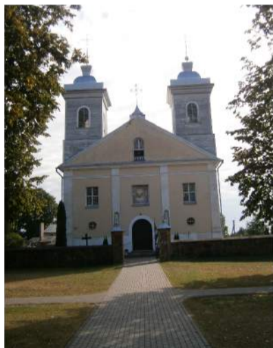
Pandėlys galima paklausti varpų.