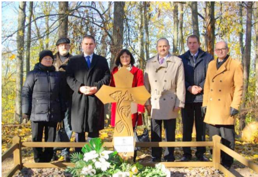
Rumunijos ambasadorius (trečias iš kairės) aplankė netoli Ilzenbergo dvaro esantį kapą.