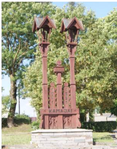
Kamajai laukia svečių.

Strazdeliu vadinamas kunigas buvo nemėgstamas vyskupijos kurijos, tad nuolat kilojamas iš vienos parapijos į kitą. Paskutiniaisiais gyvenimo metais (1820 – 1833) jis apsistojo Kamajuose, dūminėje pirkelėje. Po mirties palaidotas ne prie bažnyčios, tačiau kapinėse, o kapas gan greitai pamirštas. Susizgribus ir panorus įamžinti Antano Strazdo atminimą, kapo vieta jau buvo pamiršta, tad paminklas pastatytas kapinių viduryje. Jis atidengtas 1933 metais.