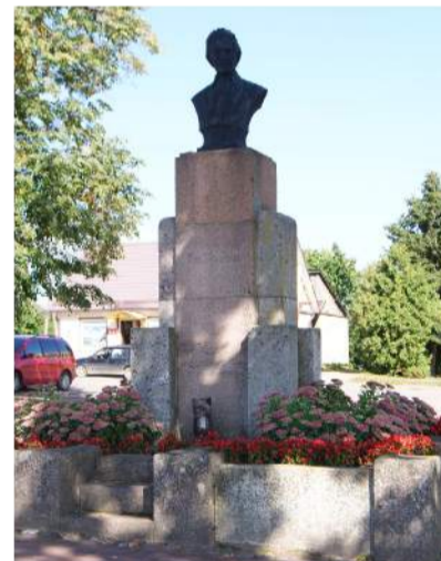
Paminklas Antanui Strazdui.

Jūžintuose esanti Šv. Arkangelo Mykolo bažnyčia pastatyta 1792 m. Iki 1832 metų čia veikęs atgailos kanau-ninkų vienuolynas – vienas vėlyviausių baroko architektūros ansamblių Lietuvoje. Statant bažnyčią panaudoti