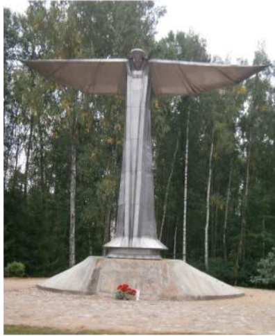
Skulptūra Angelas Panemunyje.

Beje, Antano Strazdo, „prasčioko kunigo“ gėrbėjus iki šiol traukia jo išgarsintas Kamajų miestelis. Kraštiečių