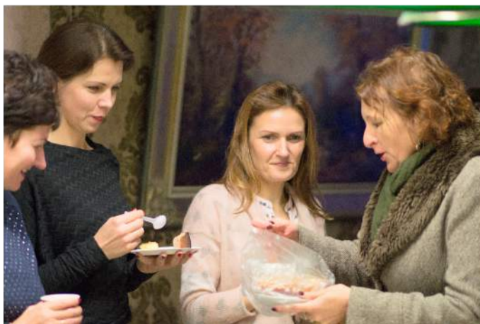
Renginio metu netrūko šypsenų bei malonių pokalbių.