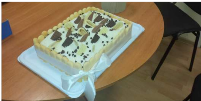
Kavinė „Lividė“ iškepė specialiai Pyragų dienos akcijai skirtą tortą, kuris, drauge su paaugotais pinigais, nukeliavo į Dienos centrą vaikams.