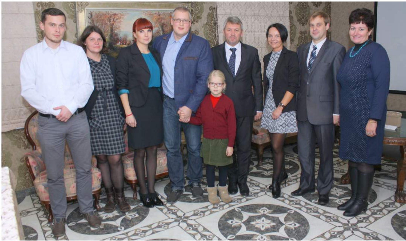
Esame dėkingi visiems, kurie apsilankė ir prisidėjo prie „Pyragų dienos“ akcijos.