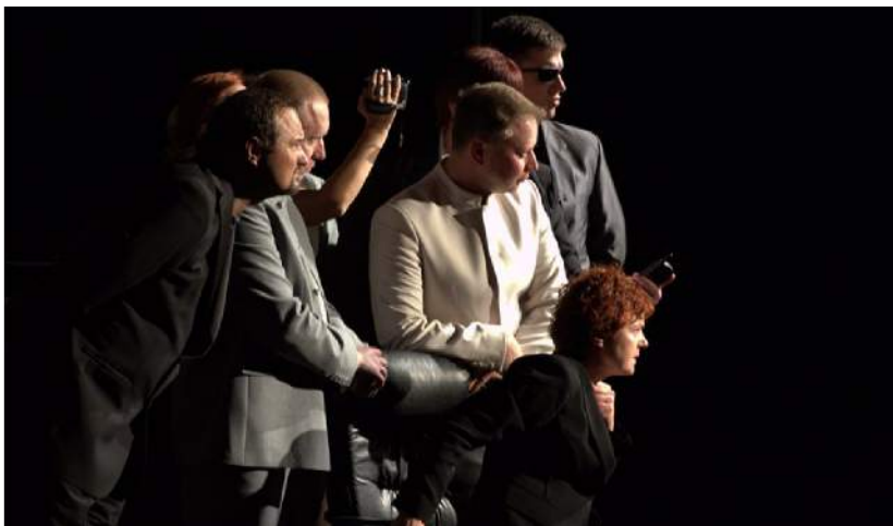
Spektaklio „Drakonas“ akimirkos.