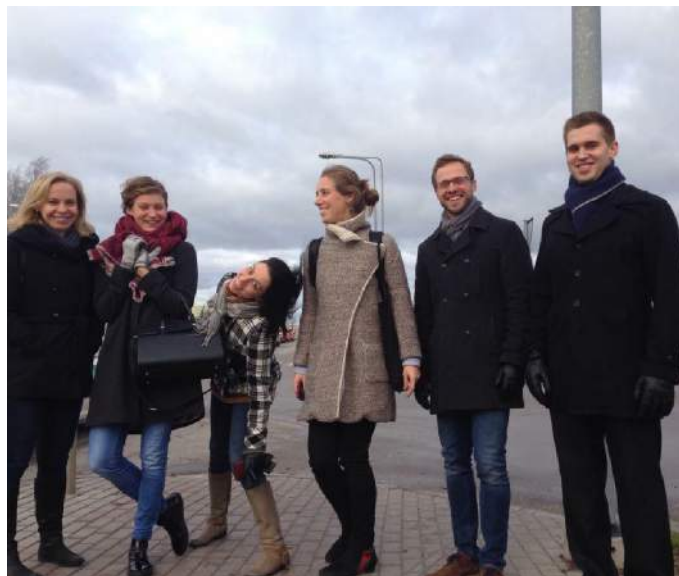
Festivalio dalyviai po koncerto skirti vaikams.

KELEIVIŲ IR SIUNTINIŲ PERVEŽIMAS! NUO DURŲ IKI DURŲ!