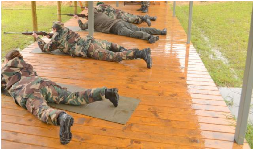
11 komandų bandė išsiaiškinti, kuri taikliausiai šaudo.