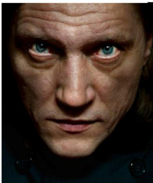
Muzikinis spektaklis „Gražuolė ir pabaisa“ dar nepasirodęs sulaukė didelio populiarumo