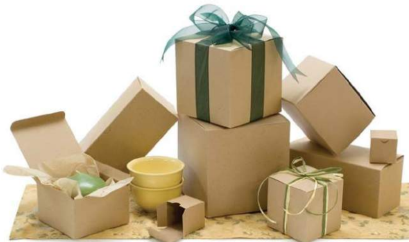
Daug daiktų nebūtinai reiškia gražias, jaukias ir spalvotas Šv. Kalėdas. Kartais užtenka mažai, tačiau su šiluma ir meile pagamintų dovanų.

Sustoti ir pagalvoti – ar tikrai tiek reikia, ar nauji pirkiniai suteikia laimės. Tai padaryti ragina dienos sumanytojai ir iniciatoriai. Pirmiausiai į „Nieko nepirk“ dienos minėjimą įsitraukė gamtosaugos bei socialinėmis problemomis besidomintys žmonės. Juk mūsų vartojimas sukelia grėsmes mums patiems – didina taršą, korporacijos skatina ieškoti kuo pigesnės darbo jėgos ir gaminti vis daugiau ir daugiau daiktų. Vis nepamirštama paminėti, jog ekonomiškai išsivysčiusios šalys, kuriose