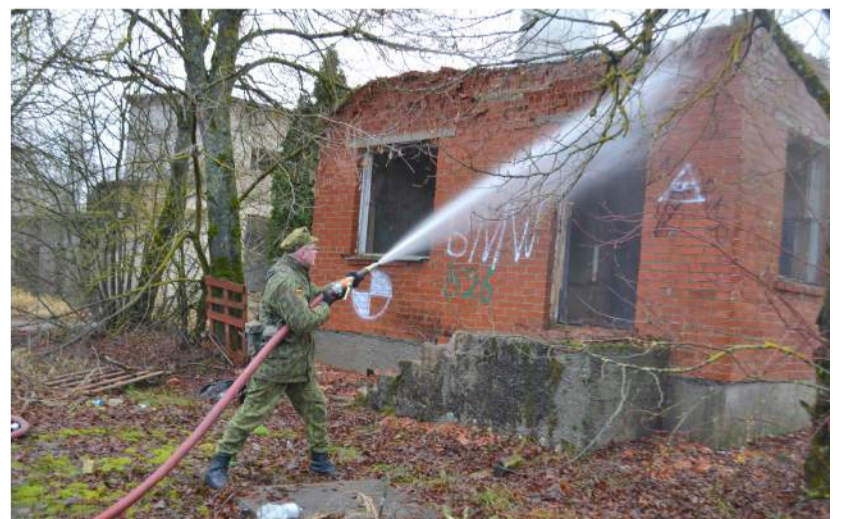
Rokiškio ugniagesiai gelbėtojai supažindino jaunuosius šaulius ir leido išbandyti jų naudojamą gesinimo ir gelbėjimo įrangą.