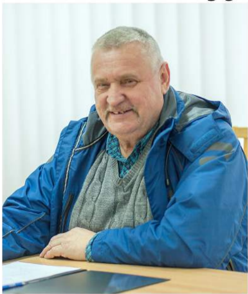
Ar grįš kiaulės į ūkininkų tvartus?