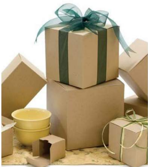
„Nieko nepirk“ diena ir (ne)išvengiamas Kalėdinio išlaidavimo artėjimas