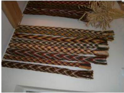
Štai tokias juostas galima išmokti pasidaryti patiems.