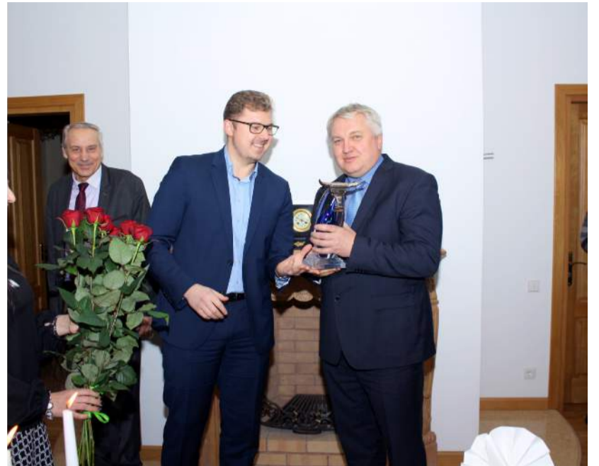
Dovana Rokiškio verslo klubo vadovui.