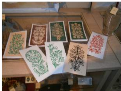
Rankų darbo karpiniai, pavirtę sveikinimo atvirukais, pradžiuogins kiekvieną.