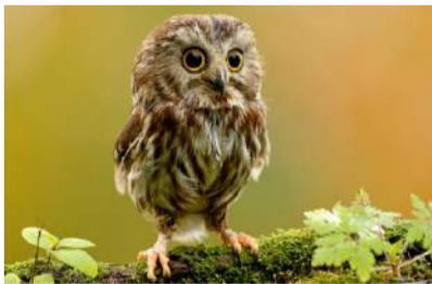
Pažinti gamtą bei jos gyventojus įdomu visiems.

Būrelyje vaikai gali žaidimo forma ar keliaudami po apylinkes bei įvairias įstaigas susipažinti su gyvąja gamta, ekologija, aplinkosauga. Kaip pasakojo būrelio vadovė, kabinete jau įsikūrė akvariumas su žuvytėmis, kuriomis rūpinasi visi vaikai. Juk jas reikia ne tik pamaitinti, bet ir pakeisti vandenį, tad veiklos prižiūrint augintinius netrūksta. Šiuo metu būreliui trūksta žiūronų, mikroskopų, fotoaparato ir panašios įrangos, kuri padėtų mažiesiems pažinti