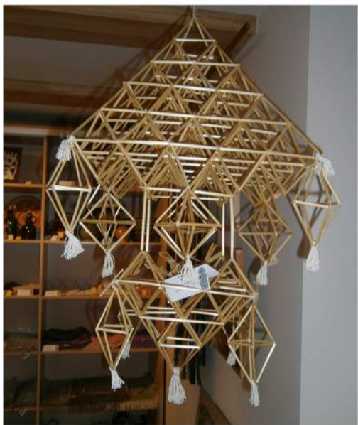
Leisk laiką įdomiai: ko galima išmokti Rokiškyje ir rajone