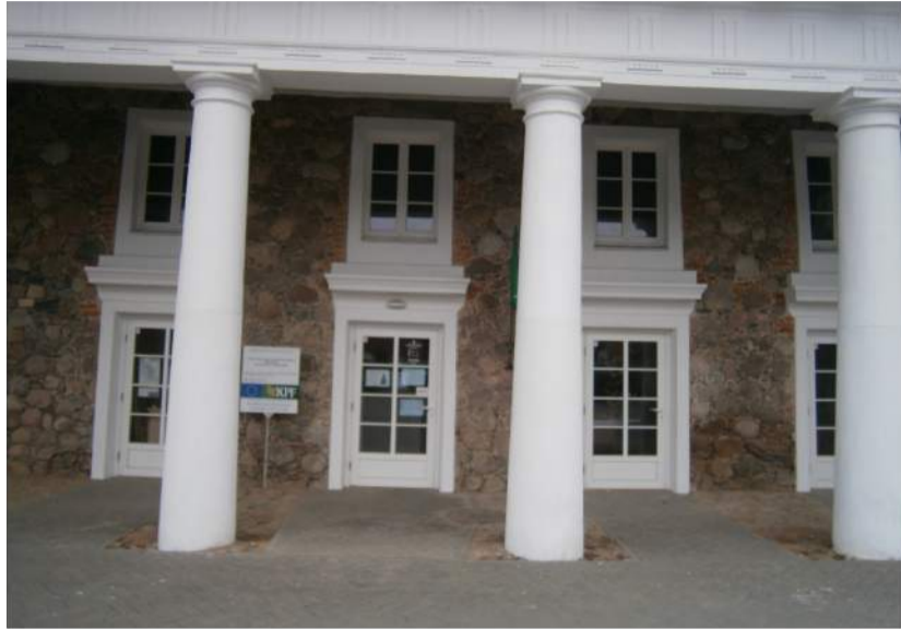
Rokiškio turizmo ir amatų informacijos ir koordinavimo centras lankytojus kviečia laiką leisti įdomiai.

Šį penktadienį Rokiškio turizmo ir tradicinių amatų informacijos ir koordinavimo centras rokiškėnus kviečia į karpinių iš popieriaus edukaciją „Kalėdinis atvirukas“, kurios metu kiekvienas pasigamins unikalų kūrinį. Vietų į šią pamoką jau nebeliko, tačiau visi norintys gali registruotis į gruodžio 2 ir 11 dienomis vyksiančias kalėdinių šiaudinių žaisliukų kūrybines dirbtuves. Kaip sakė organizatoriai, nei vienas pirktinis žaisliukas nesuteiks tiek daug džiaugsmo kaip eglutės puošmena, kurią pasigaminai savomis rankomis. Tai – tikrai ne viskas, ko galima išmokti užsukus į šią įstaigą. Kviečiame susipažinti su Rokiškio turizmo ir tradicinių amatų informacijos ir koordinavimo centro siūlomomis edukacinėmis programomis.