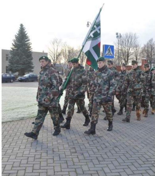
Turingas jaunųjų šaulių savaitgalis