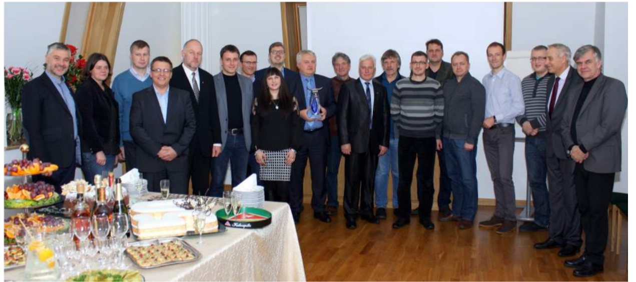
Rokiškio verslo klubo ir Vietos veiklos grupės atstovai negailėjo jubiliatui linkėjimų.