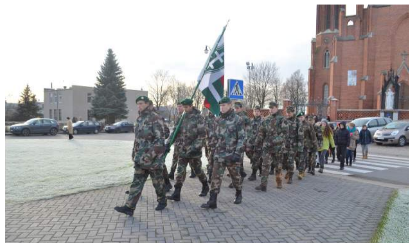
Po šv. Mišių būrys jaunųjų šaulių patraukė link Nepriklausomybės paminklo, kur iškilmingai pasižadėjo ginti ir saugoti Lietuvos nepriklausomybę.