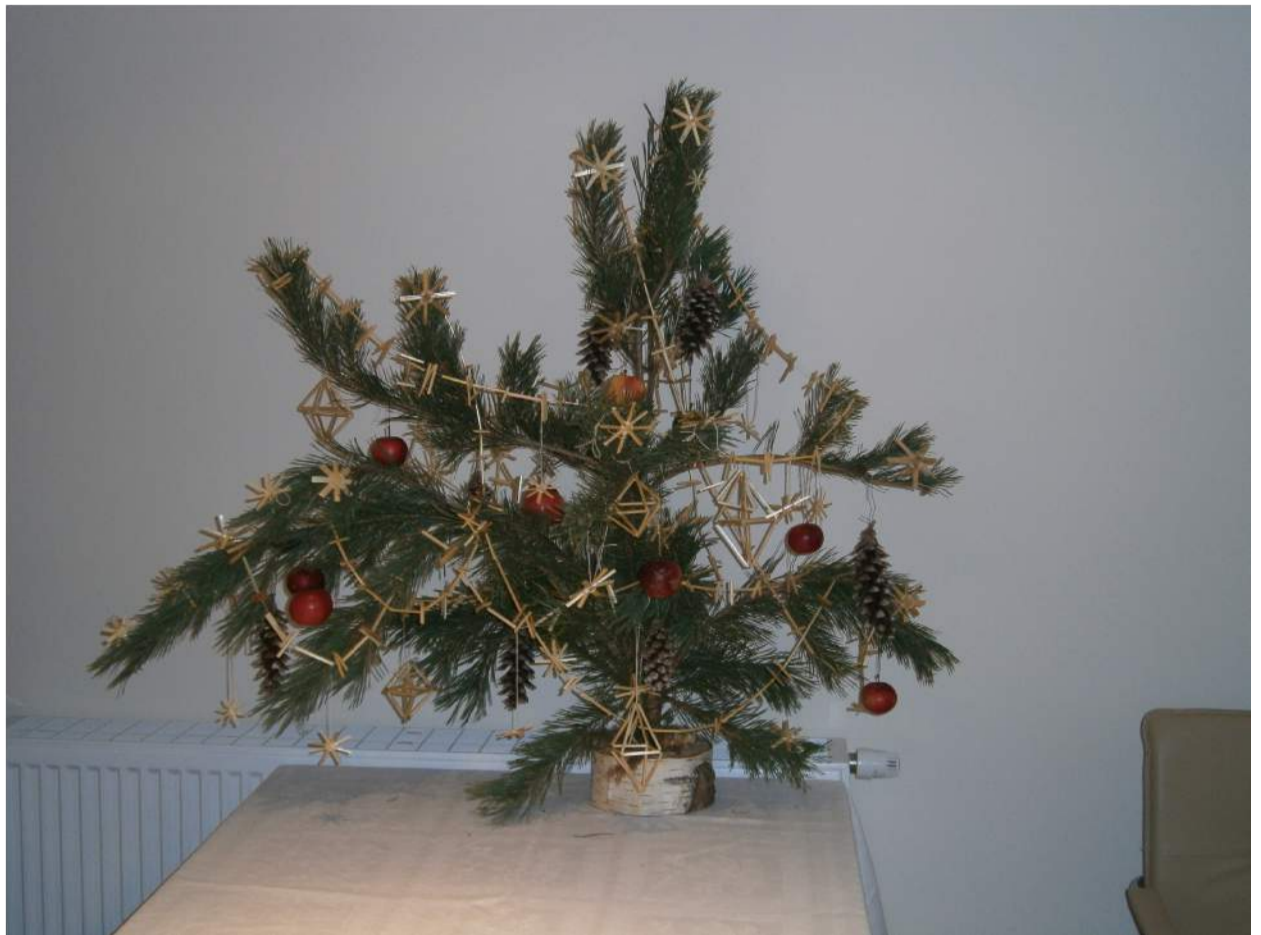
Taip papuošta eglutė kelia susižavėjimą ne vienam. Visi norintys kviečiami susipažinti su kalėdinių žaisliukų gamybos iš šiaudelių paslaptimis. Rezultatas pradžiuogins ne tik jus, bet ir artimuosius.