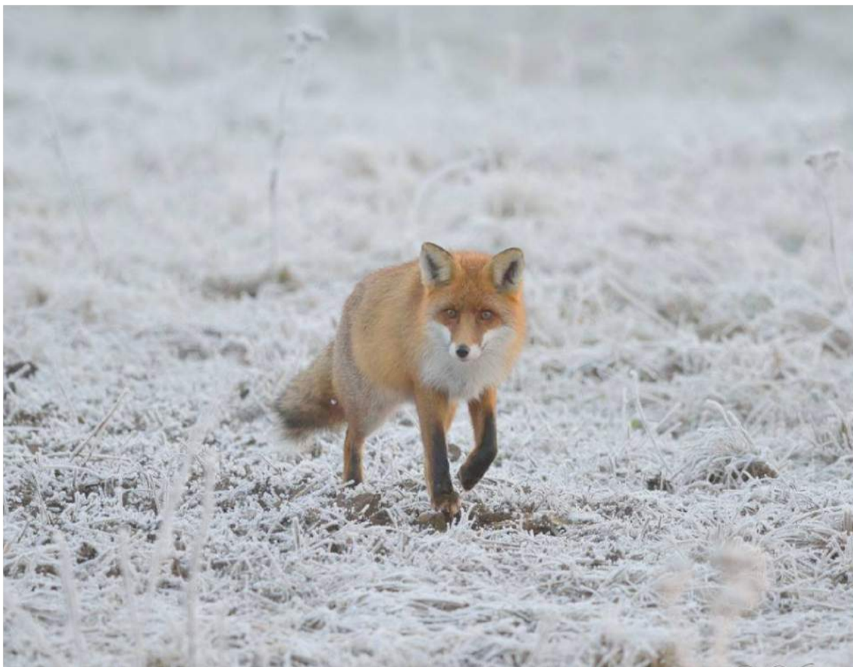
Lapės – visus metus medžiojami gyvūnai, tačiau daugeliui gamtos mylėtojų jos – žaismingas gyvūnas, kurį labai įdomu stebėti.

Buketuose, lankstinukuose, turistiniuose vadovuose jis nurodytas galvojant apie tuos, kurie keliauja vasarą. Upių ilgis skirtingais metų laikais nesikeičia, tačiau dienos ilgumas – taip. Gruodžio viduryje šviesūs dienos laikai tik septynios su puse valandos ir dalį jų reikėtų skirti nakvynės vietos paieškoms, iširengimui, priklausomai nuo to, kur apsistojote – aplinkos sutvarkymui ryte. Taip pat svarbu pasilikti laiko nenumatytiems atvejams – jei plaukiant sušlapote vasarą, drėgni drabužiai vėsins. Tačiau kai aplinkos temperatūra tik keli laipsniai šilumos, teks sustoti, išlipti ir persirengti. Užsiminus apie aprangą norisi pasikartoti – tai svarbu! Nuo vandens kylanti drėgmė bei šaltis užuomaršų negaili, tad šiltais, judesių nevaržančiais bei neperšlampamais drabužiais vertėtų pasirūpinti iš anksto. Beje, taip pat atkreipti dėmesį į daiktų pakavimą. Atšalus orams nėra malonu nardyti vandenyje ieškant nuplaukusio maišo su svarbiais dokumentais, telefonais ir raktais.