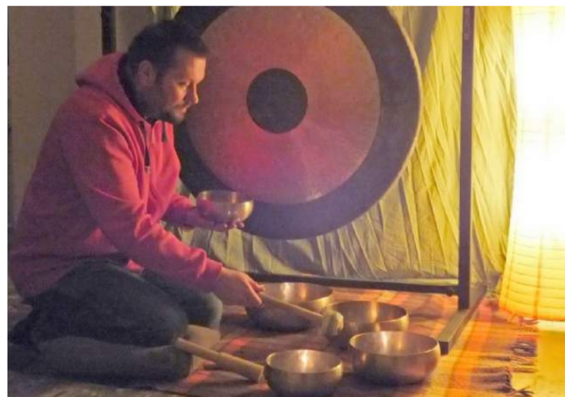
Gongų muzikos meditacija veikia ir protą, ir sielą, ir kūną.

Ar pirmą kartą į terapiją atėję žmonės gali pajusti visų garsų niuansus? Pašnekovai sakė, jog išties tam reikėtų daugiau seansų. „Per pirmą užsiėmimą tiesiog patiri, kas tai yra, išbandai. Meditacija – tai savęs stebėjimas, suvokimas, kas man trukdo ar padeda, save tarsi nuskanuoji. O to reikia mokytis, juk esame labai įsitęmę, retas kuris iš karto atsiveria. Tad kam nusiteikti, jei norisi susipažinti su gongų