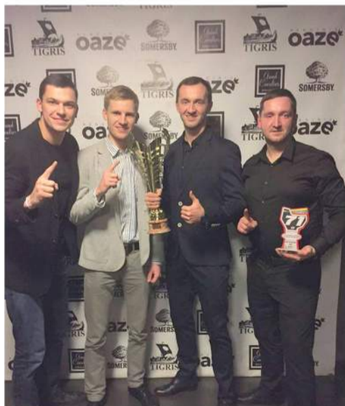
Apdovanoti geriausi motokroso sportininkai