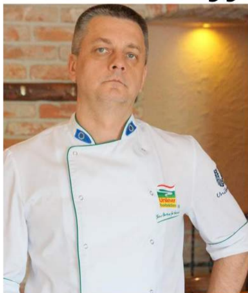
Kai rizikingi sprendimai virsta svajone