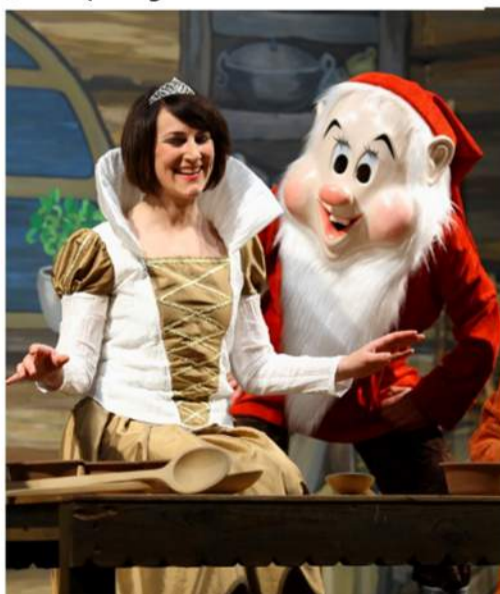
Šventinis laikotarpis Rokiškio kultūros centre