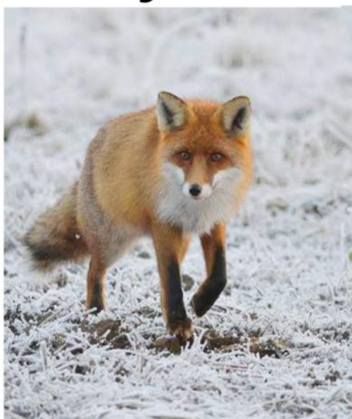
Kalendorinė žiema – ne kliūtis aktyviam laisvalaikiui gamtoje