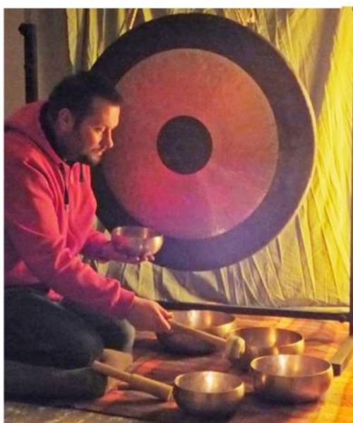
Kalėdinis laikotarpis – nuo gongų meditacijos iki koncerto „Kalėdų Gongai“