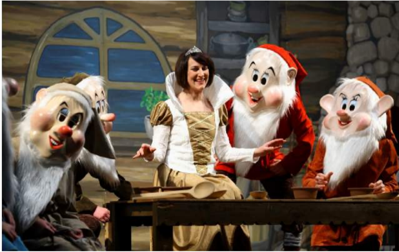
Mažųjų laukia šventinis sutikimas su pasakų herojais.