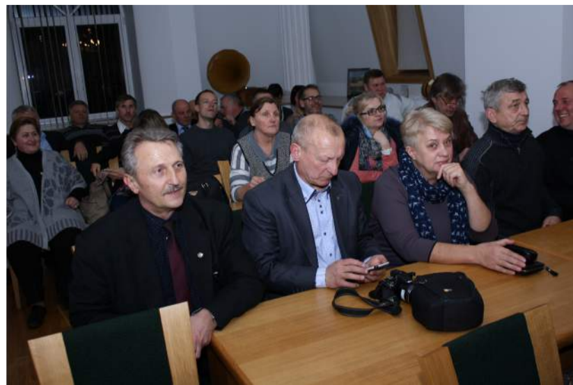
Konsultacijos – puiki proga užduoti rūpimus klausimus, susipažinti su naujienomis bei pateikti pasiūlymus.