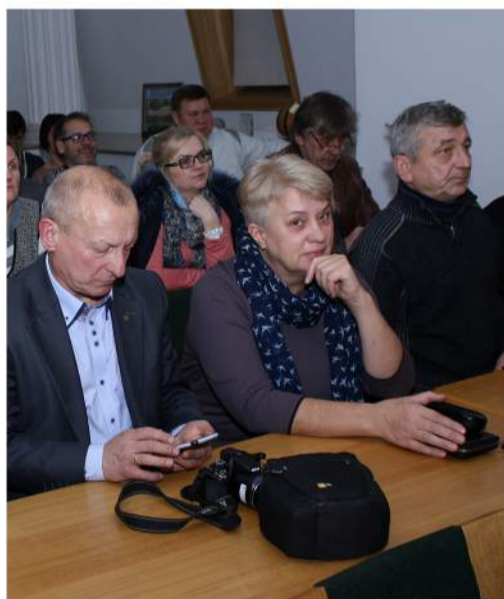
Rokiškio miesto vietos veiklos grupė: dirbame aktyviai bei viešai