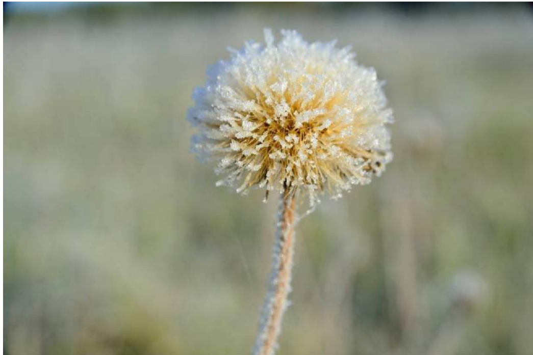
Serkšnu pasidabinę laukai ar upių pakrantės – nepakartojami išpūdziai, kuriuos galima patirti keliaujant šaltuoju metų laiku.