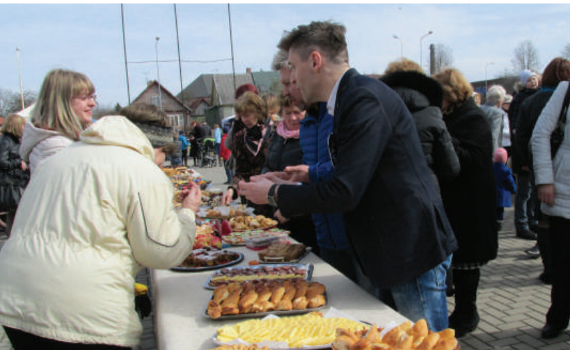
Žmonės buvo kviečiami susėsti prie bendro stalo, pasimėgauti puodeliu arbatos, pabendrauti.