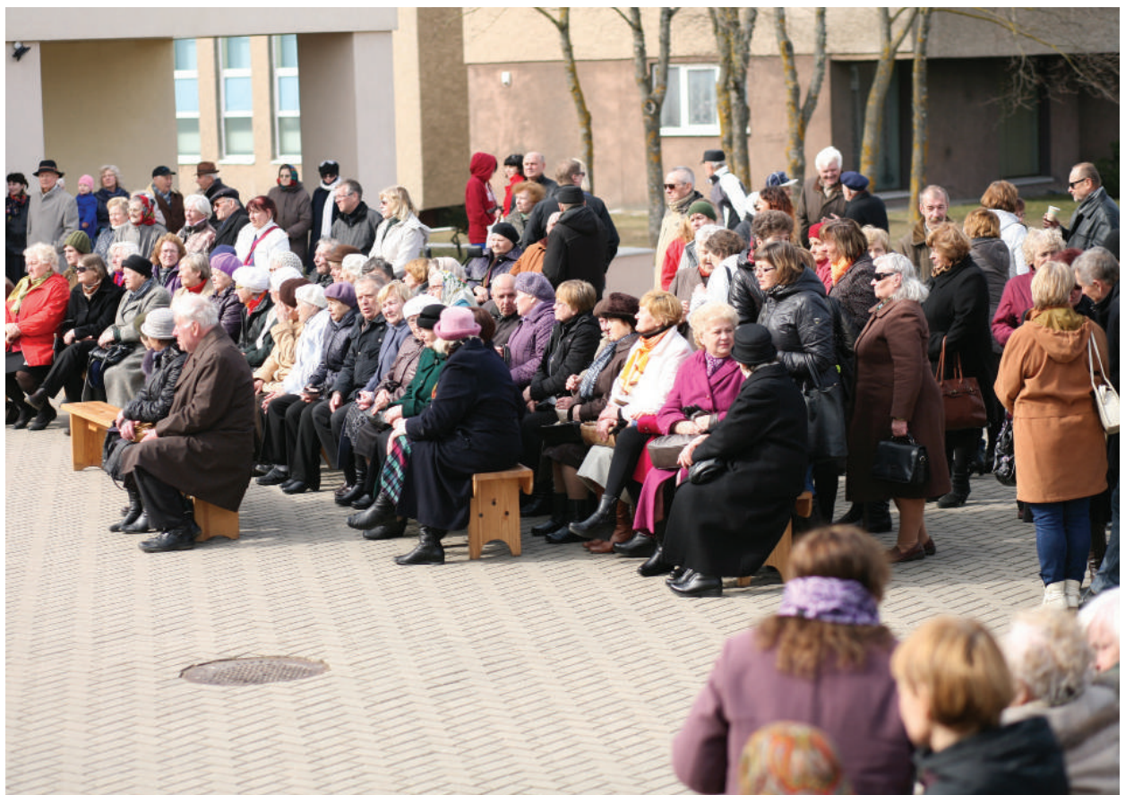
Atvelykis prasidėjo šv. Mišiomis Šv. Mato bažnyčioje. Po jų rokiškėnai rinkosi prie Kultūros centro.