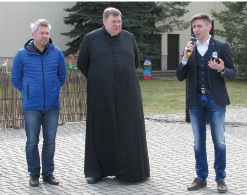
Šventės organizatoriai ir globėjai ragino kartu pasidžiaugti gražiąja pavasario švente.

Atvelykio šventėje laukė smagios pramogos. Mažieji dalyvavo įvairiuose žaidimuose: rideno margučius, rinko gražiausią margutį. Vaikus linksmino Kultūros centro vaikų folkloro ansamblis „Bitula“. Suaugusiems dainavo ir šoko Rokiškio Kultūros centro folkloro kolektyvai „Gastauta“ ir „Saulala“. O 15.40 val. kultūros centro didžiojoje salėje buvo rodomas filmas „Pirmasis Dievo gailėstingumo paveikslas“. Organizatoriai išsakė lūkestį, jog tikisi, kad ši graži šventė taps tradicija ir sutikti Velykėles rokiškėnai galės vėl kartu.