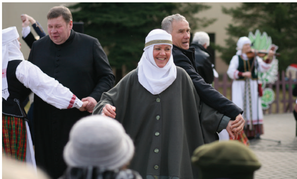
Atvelykis paminėtas šokio ritmu.

ma su giminėmis, jeigu dėl kažkokių priežasčių nepavyko pasimatyti per Velykas. Šią dieną vėl dažomi kiaušiniai (anksčiau kaime dažydavo visus kiaušinius, kuriuos per savaitę sudėjo vištos), ridenami margučiai, supamasi sūpynėse.