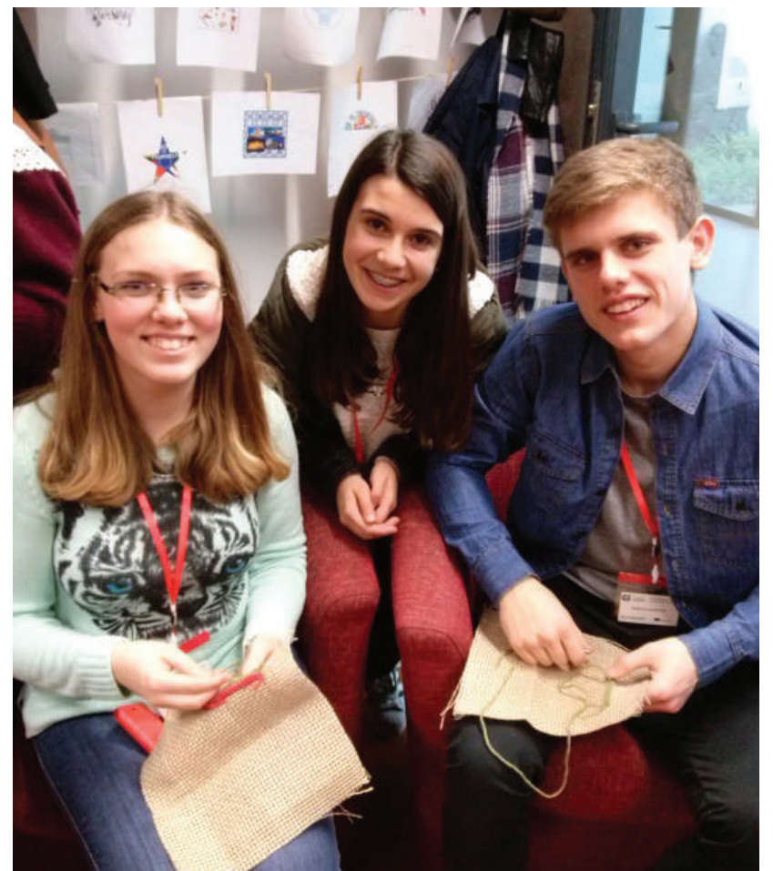
Akimirka iš kūrybinių dirbtuvių.