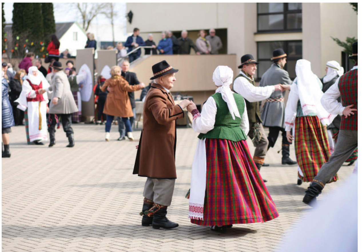
Vyresni galėjo iki soties prisišokti...