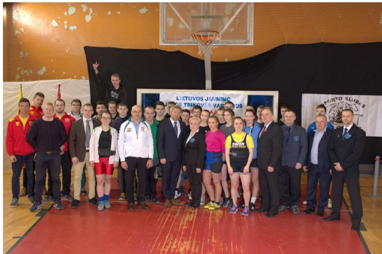
Bendroje nuotraukoje sportininkai įsiamžino su pačiu rajono meru Antanu Vagoniu.