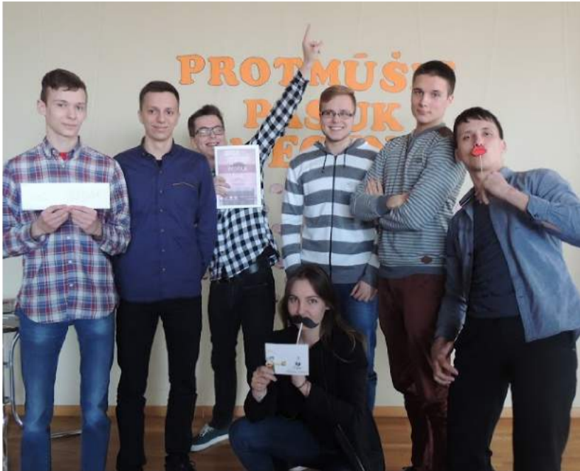
Protmūšio nugalėtojai - komanda „Gengas“.

Jaunųjų Lyderių klubo prezidentė sako, jog protų mūšiai yra puikus būdas naudingai ir linksmai praleisti laiką. Šiais laikais jauni žmonės dažnai pamiršta, kad mokslas gali būti įdomus. Mokykloje viską mokomės labai „sausai“, o protmūšiai mums leidžia nutolti nuo mokyklos suolų ir pasinerti į tikrąjį žinių pasaulį.