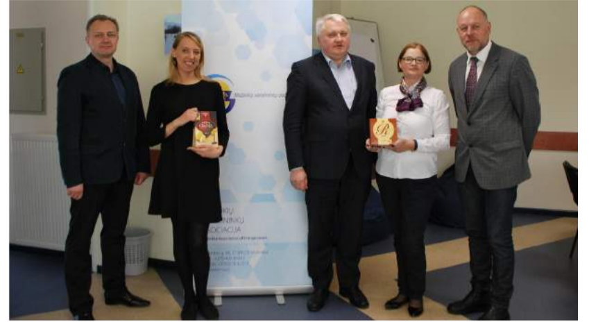
Susitikimo metu aptartas ir tolimesnis bendradarbiavimas, galimybės kartu vykdyti veiklas. RVK nuotr.

Tai, jog susitikimo būta naudingo, liudija aktyvus susirinkusiųjų dalyvavimas diskusijose, dalinimasis patirtimi: asociacijų nariai ne tik pasakojo apie savo veiklas, darbus, bet ir dalinosi įspūdžiais. Rokiškio verslo