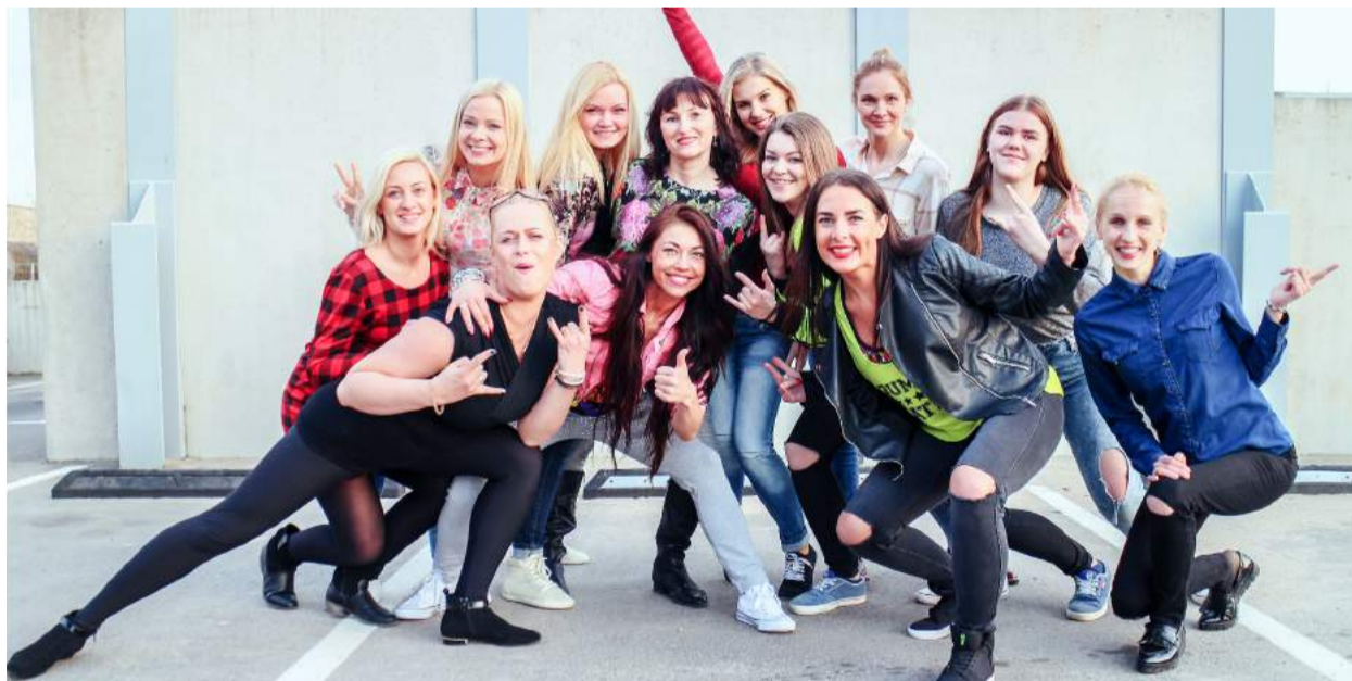
Po siurprizo rokiškėnams šokėjos nestokojo geros nuotaikos.

Balandžio 29 d. picerijoje „Pipirini Pizza“ vakarieniaujančių rokiškėnų laukė tikra staigmena. Netikėtai iš savo vietų pakilusios žavios merginos pradėjo energingai šokti, taip sukeldamos ne vieno picerijos lankytojo nuostabą. Tokia netikėta staigmena buvo paminėta Tarptautinė šokio diena.