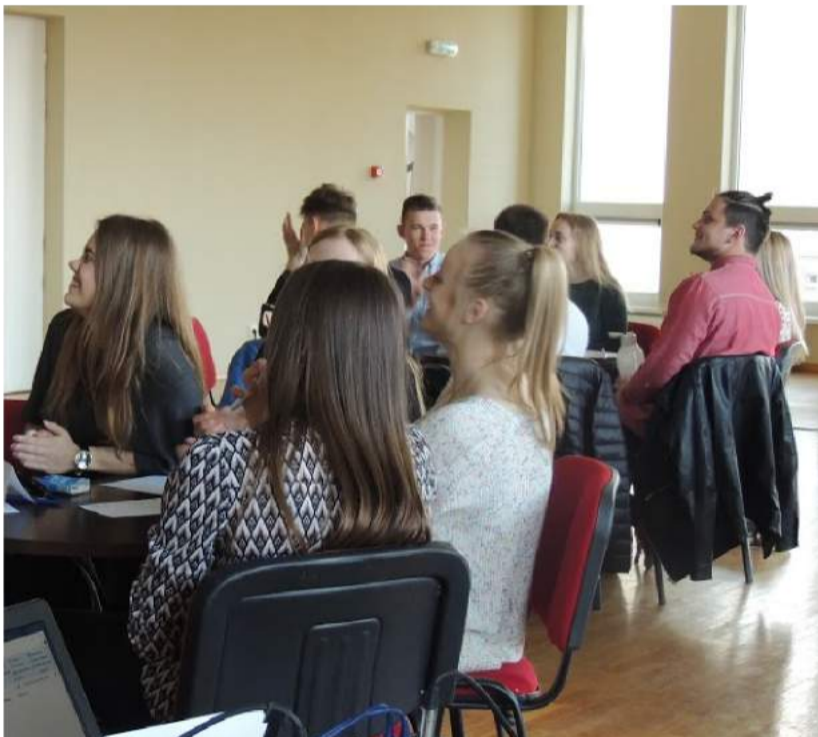
Protmūšis „Pasuk smegenis“.