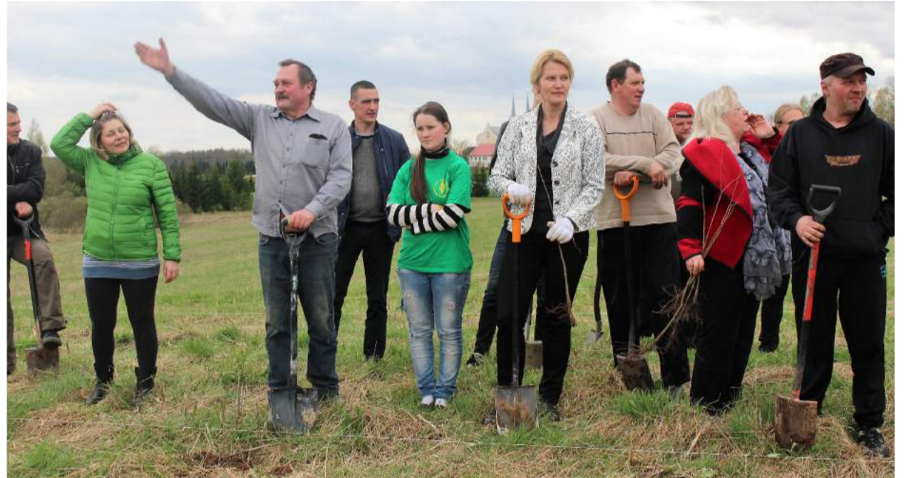
Akcijos metu buvo pasodinta 270 ažuoliukų.