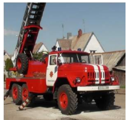
Ugniagesiai demonstravo turimą įrangą bei savo sugebėjimus.