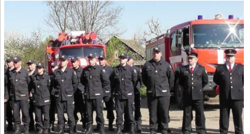
Šventės metu apdovanoti geriausi ugniagesiai.