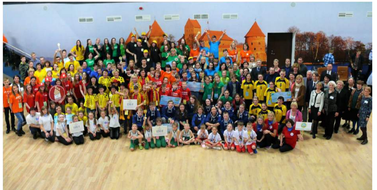
Trakuose rungtyniavo 40 komandų (280 dalyvių) iš visų Lietuvos kampelių.