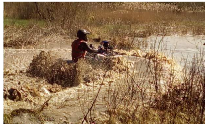
Sportininkai savo plieninius žirgus be gailėsčio skandino purvo voniose.