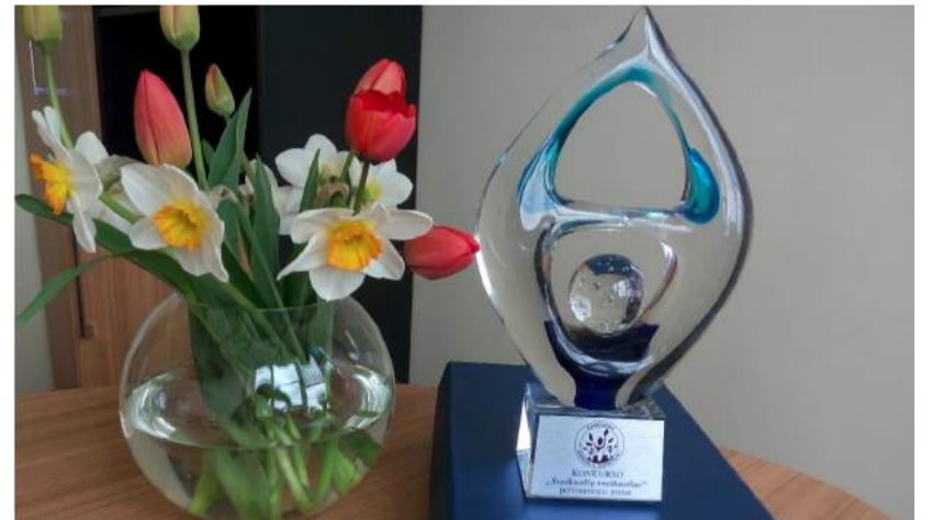
Iškovotas pereinamasis prizas.

Daugiau informacijos galima rasti www.smlpc.lt