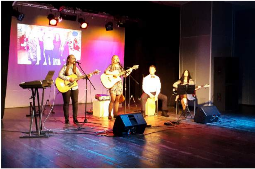
Grupės „Atspalviai“ koncertas.

Gegužės 6 d. Kultūros centro mažojoje salėje vyko Rokiškio Rudolfo Lymano muzikos mokyklos mokinių grupės „Atspalviai“ koncertas „Mes neišeinam“.