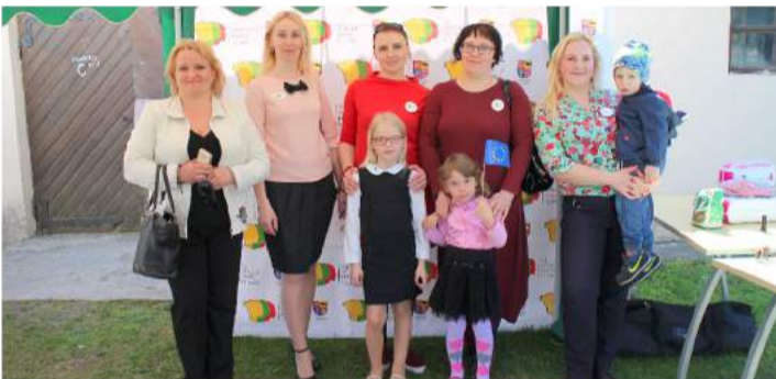
Rokiškio veiklių mamų klubo mamos visiems besidomintiems pristatė savo veiklą.