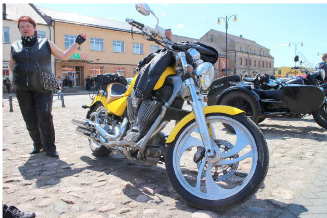
Nepriklausomybės aikštėje smalsuoliai apžiūrėjo tiek prabangius motociklus...