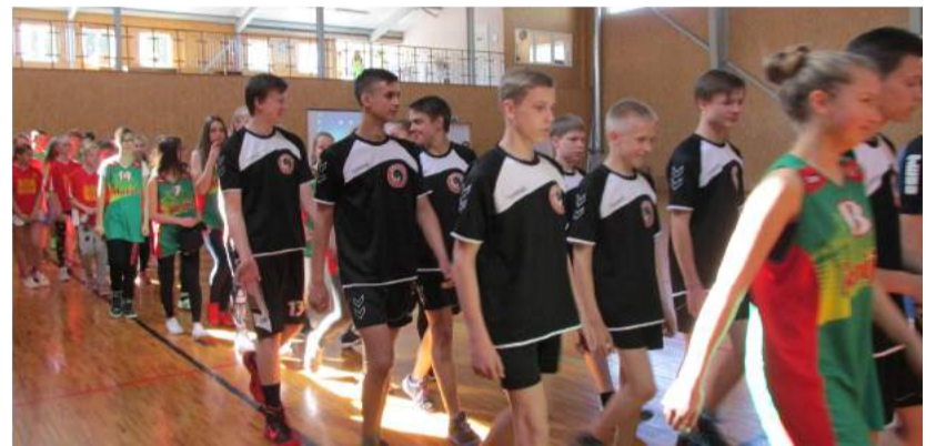
Susitikimo metu mokinių komandos dalyvavo draugiškose sportinėse žaidynėse.