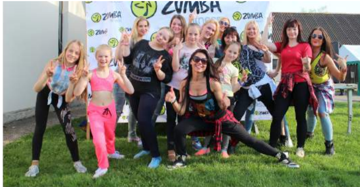
Po energingo ZUMBOS šokio – bendra šokėjų nuotrauka.

Daugiau renginio akimirklų rasite www.rokiskiosirena.lt „Rokiškio Sirena“ inform.