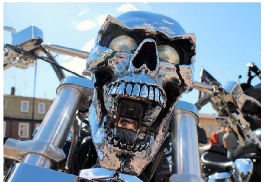
Po viešnagės Nepriklausomybės aikštėje baikerių kolona pajudėjo Kupiškio link. Ne vieno gyventojų dėmesį traukė kiek neįprastas motociklo priekinis žibintas.