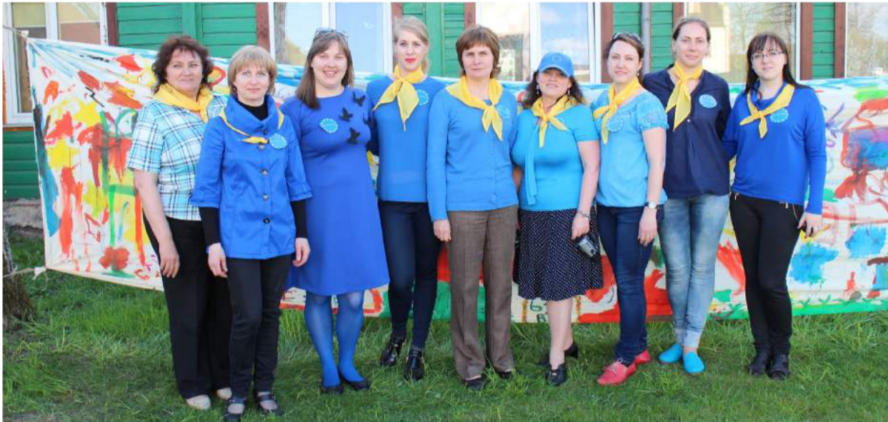
Renginio „Europietiški susitikimai prie lietuviško ažuolo“ organizatoriai.