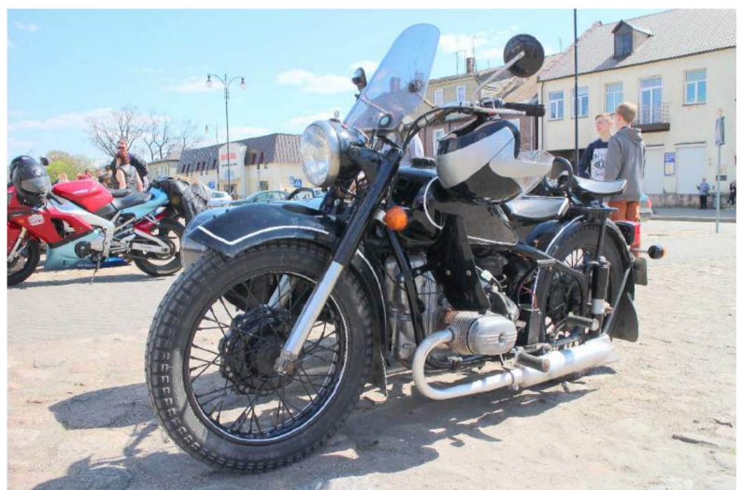
...tiek ne vieną dešimtį metų senumo „plieninius žirgus“.