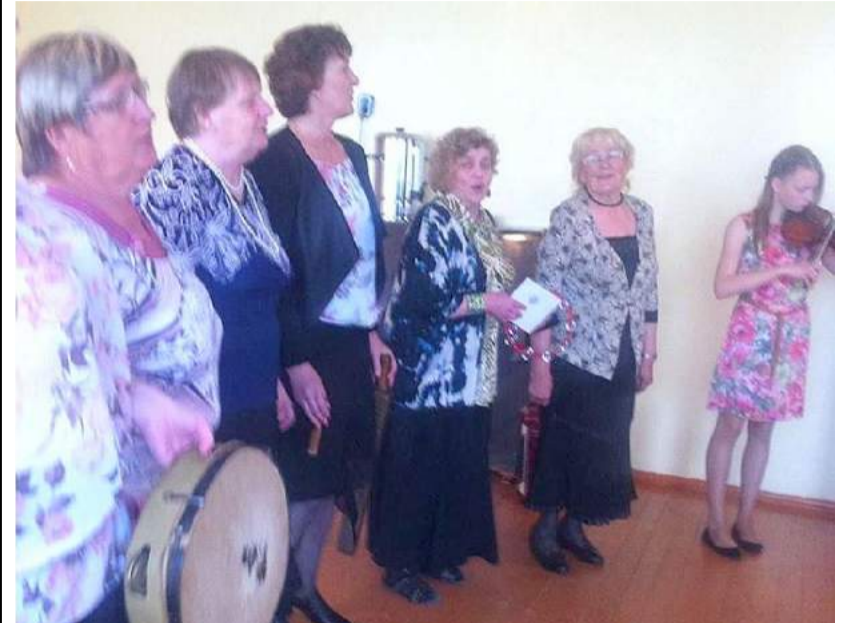
Koncertavo Aleksandravėlės kultūros centro vokalinis ansamblis „Šypsena“.

Gegužės 7 d. įvyko Aleksandravėlės kaimo bendruomenės ataskaitinis-rinkiminis susirinkimas. Aptartas ataskaitinis laikotarpis, pristatytas Socialinės apsaugos ir darbo ministerijos finansuojamas projektas „Atmintį išsaugokim ateinančioms kartoms“. Išrinkta nauja bendruomenės taryba.