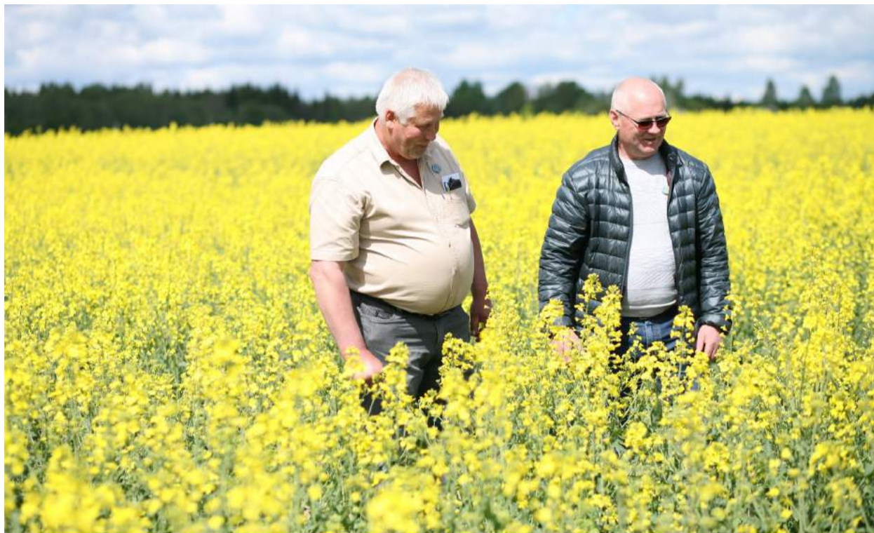
Susitikimo metu ūkininkai rapsų laukuose buvo supažindinti su naujomis rapsų veislėmis, jų auginimo technologijomis.

Po susipažinimo rapsų laukuose ūkininkai apžiūrėjo pačią kooperatinę bendrovę.