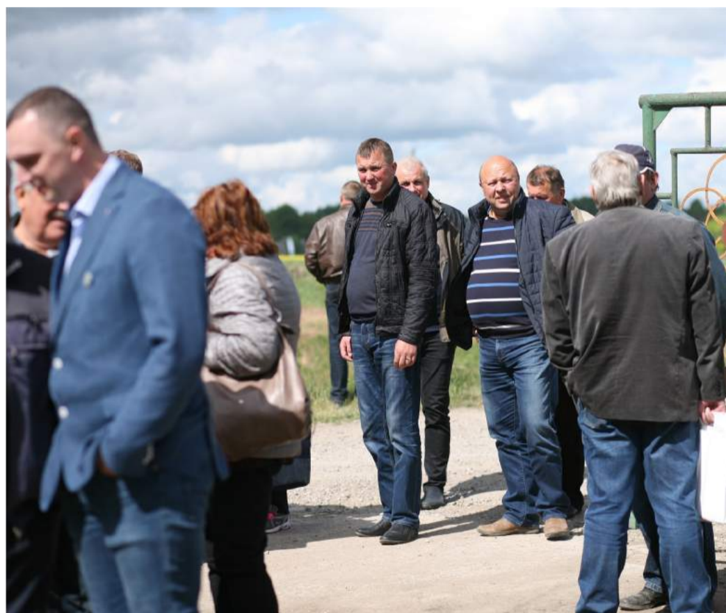
Į šventę atvyko ūkininkai iš Rokiškio, Šakių, Jurbarko, Kėdainių, Ukmergės, Jonavos, Kupiškio rajonų.