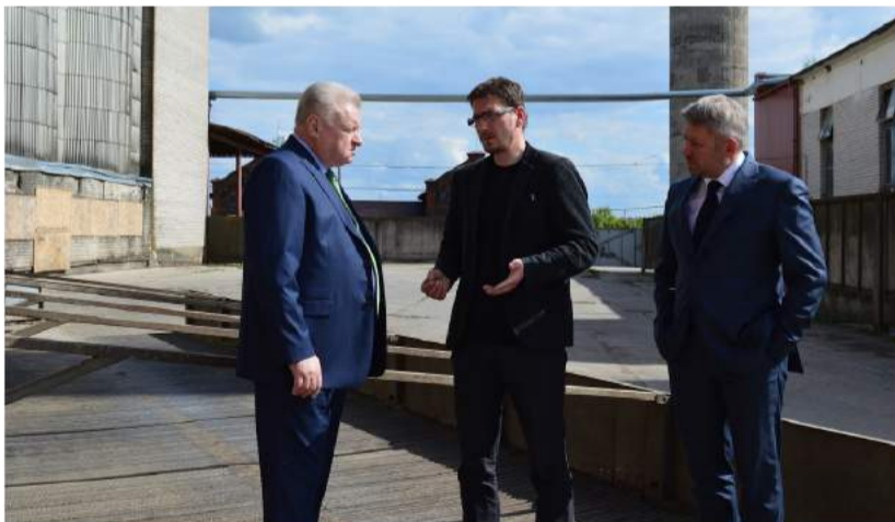
A. Udalcovas lankėsi SV „Obelių aliejus“...