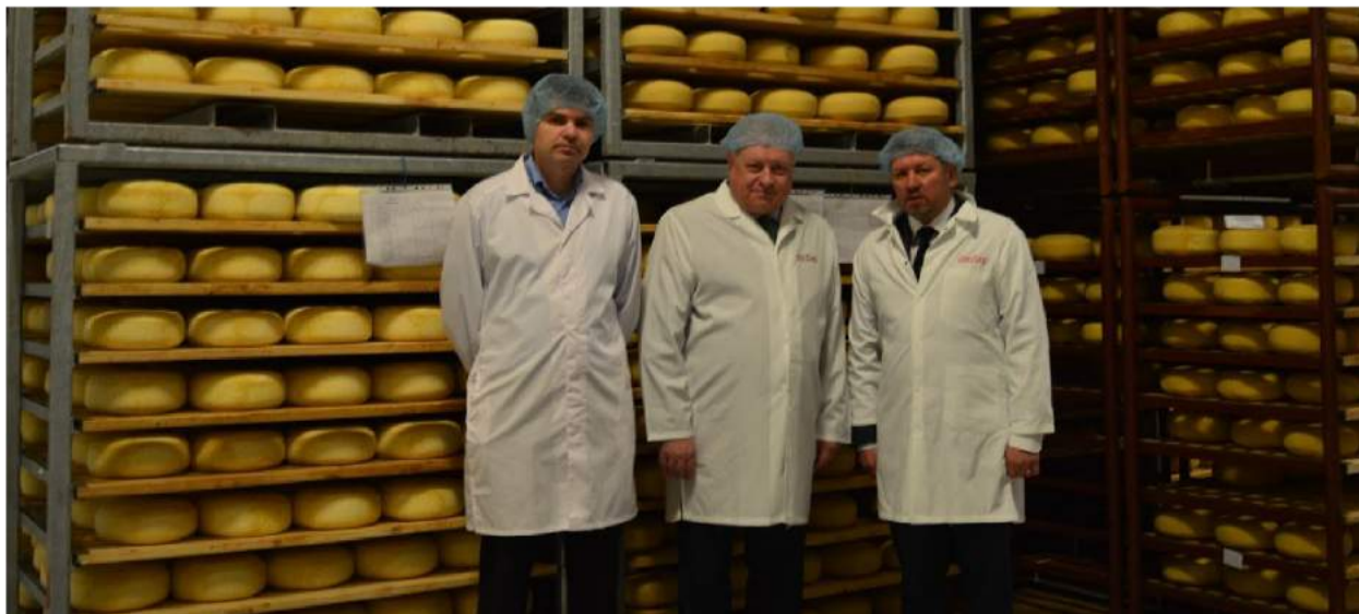
... AB „Rokiškio sūris“ gamyklose.