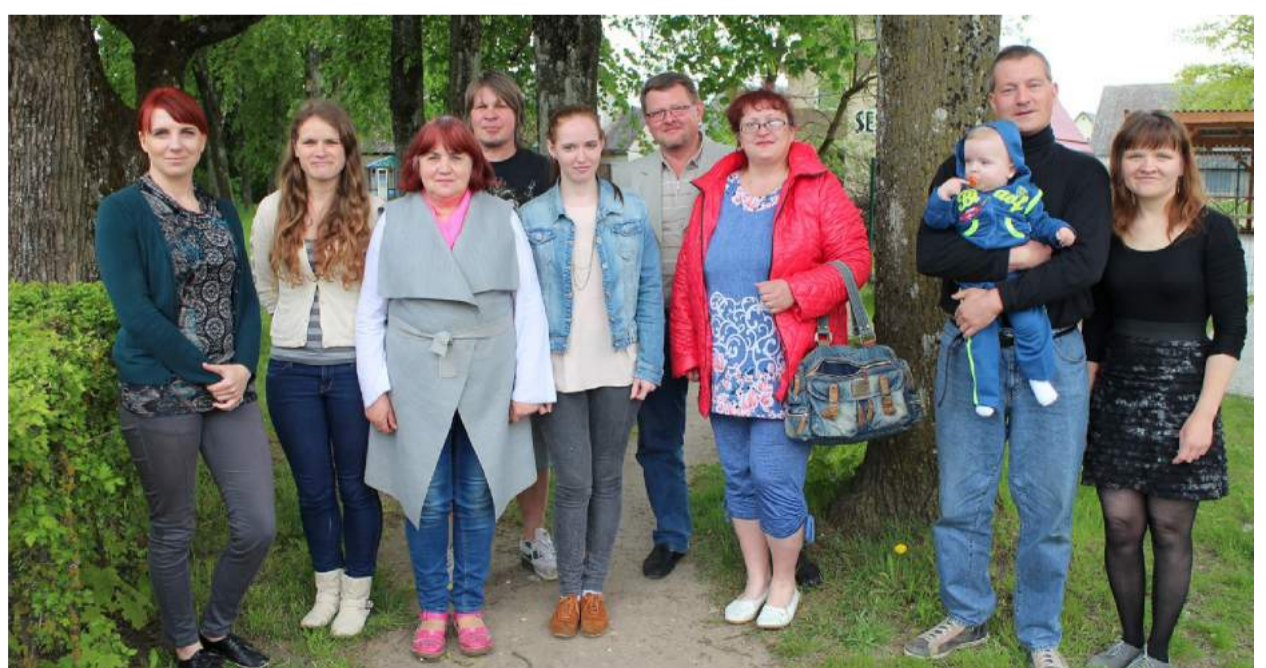
Susibūrusios šeimos galės ištiesti pagalbos ranką viena kitai.

Iniciatoriai tikisi, jog buvimas drauge duos naudos visoms mūsų rajono daugiavaikėms šeimoms.