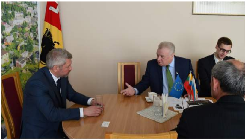
Rusijos ambasadorius Aleksandras Udalcovas su delegacija.