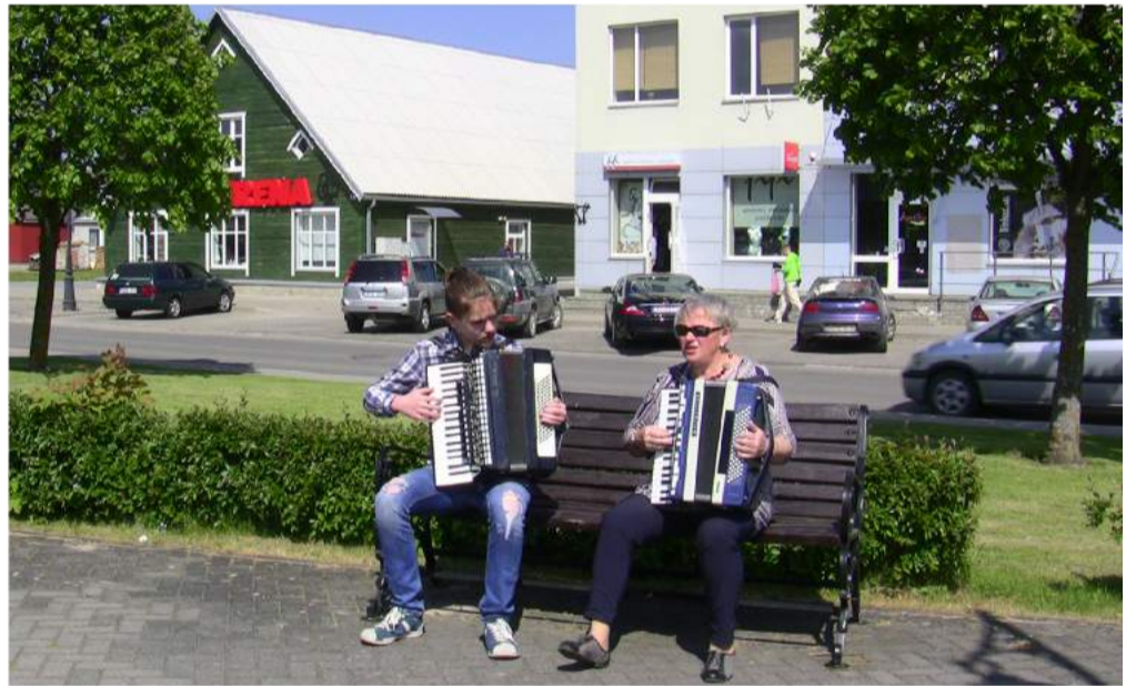
Aktyviausi Gatvės muzikos dienoje buvo Rokiškio Rudolfo Lymano muzikos mokyklos auklėtiniai.