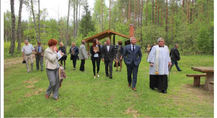
Į atidarymą atvyko rajono valdžios atstovai ir mokyklų vadovai.

Praėjusią savaitę Jūžintų Juozo Otto Širvydo pagrindinės mokyklos bendruomenei buvo tikra šventė - atidaryta per rajono VVG vykdomą projektą renovuota Žiukeliškių poilsio vieta, skirta moksleivių aktyviam poilsiui.