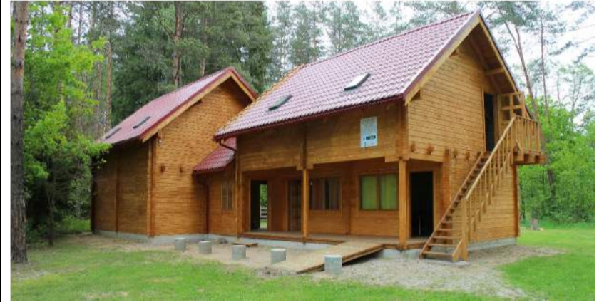
Renovuota Žiukeliškių poilsio vieta yra skirta moksleivių aktyviam poilsiui.