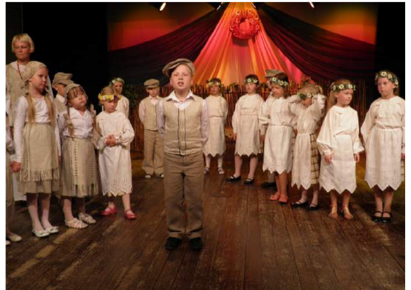
Šventėje skambėjo nuotaikingos dainos.