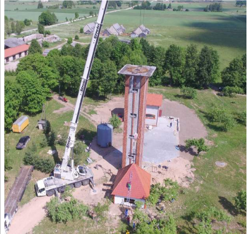
Varpinė svėrė beveik devynias tonas.

Birželio 1 – oji Skemų socialinės globos namų bendruomenei buvo be galo darbinga diena. Prie įrengti baigiamos koplyčios senas vandens bokštas pasipuošė beveik devynias tonas sveriančia varpine.