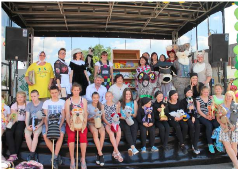
Seimo pirmininkė L. Graužinienė atidarė vardinę lentyną „Mano vaikystės biblioteka“.

Po knygų lentynos atidarymo Seimo pirmininkė iš aikštės išvyko į Salų dvarą, vėliau aplankė Bagdonišio ir Gačionių dvarus.