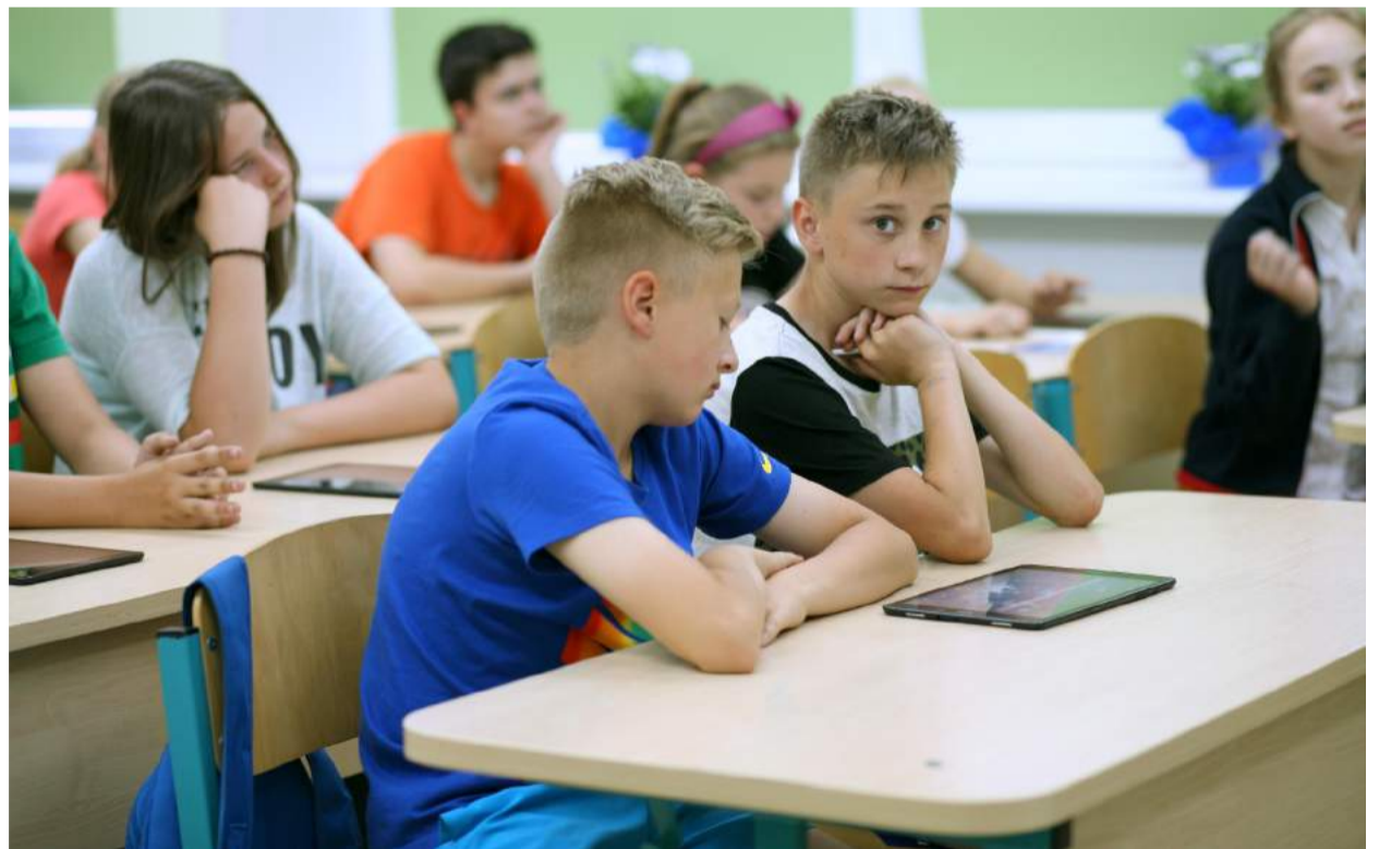
Aukštesnio lygio gebėjimai atsiranda, kai vaikai per pamokas dirba kūrybiškai, susieja teorines žinias su praktika.

Atidaryme progimnazijos sėkme džiaugėsi ne tik mokiniai ir jų tėveliai,