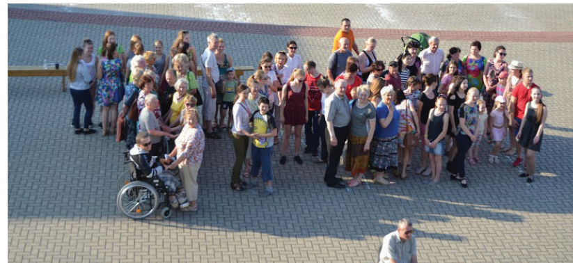
Į renginį susirinko saujelė rokiškėnų.

Birželio 1 d. 18 val. Rokiškio kultūros rūmų kieme vyko tarptautinė akcija „Taikos glėbys“. Muzika mus džiugino grupė „Atspalviai“.