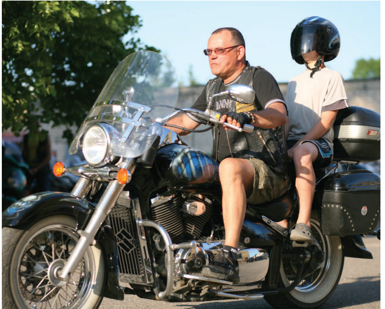
Vaikų laukiamiausia akimirka – pasivažinėjimas su baikeriais.

Birželio 1-ąją, Tarptautinės vaikų gynimo dienos proga Obelių vaikų globos namų vaikai nuo pat ryto linksmai pramogavo. Kieme netikėtai išdygo didžiulis batutas, o vakare tradiciškai į globos namų kiemą atvažiavo baikerių kolona.