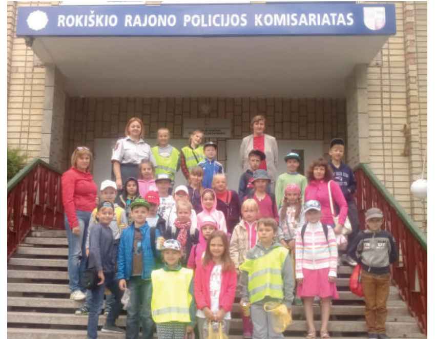
Rokiškio rajono policijos komisariatas pasikvietė pradinį klasių moksleivius į svečius.

Prasidėjusi vasara, besibaigiantys mokslo metai teikia daug džiaugsmo moksleiviams, tačiau nemažėjantis jų nusikalstamumas per atostogas nerimą kelia policijos pareigūnams ir skatina ieškoti netradicinių prevencinės veiklos būdų.