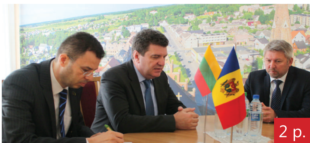
2 p. Tęsiasi diplomatinė vizitai: Rokiškyje viešojo Moldovos ambasadorius