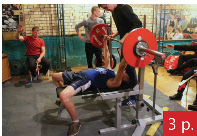
3 p. Štangos spaudimo varžybose – asmeniniai ir rajono rekordai