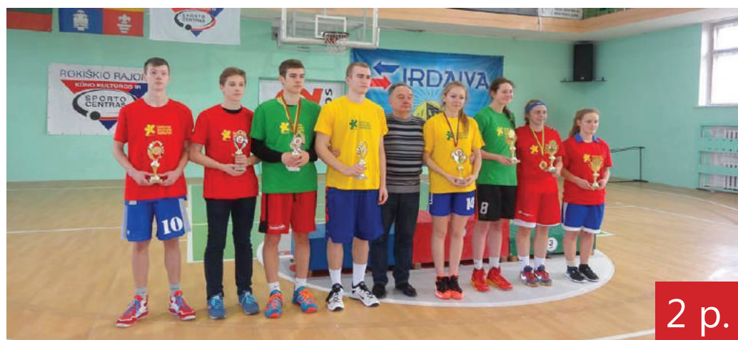
2 p. Baigėsi Lietuvos mokyklų žaidynės