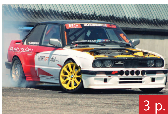
3 p. Rokiškėnas bandys „įkasti“ varžybų lyderiams