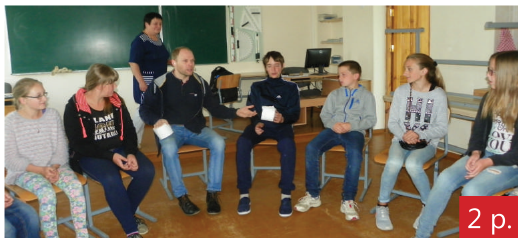
2 p. Vasaros stovykloje – sveikatingumo pamokos