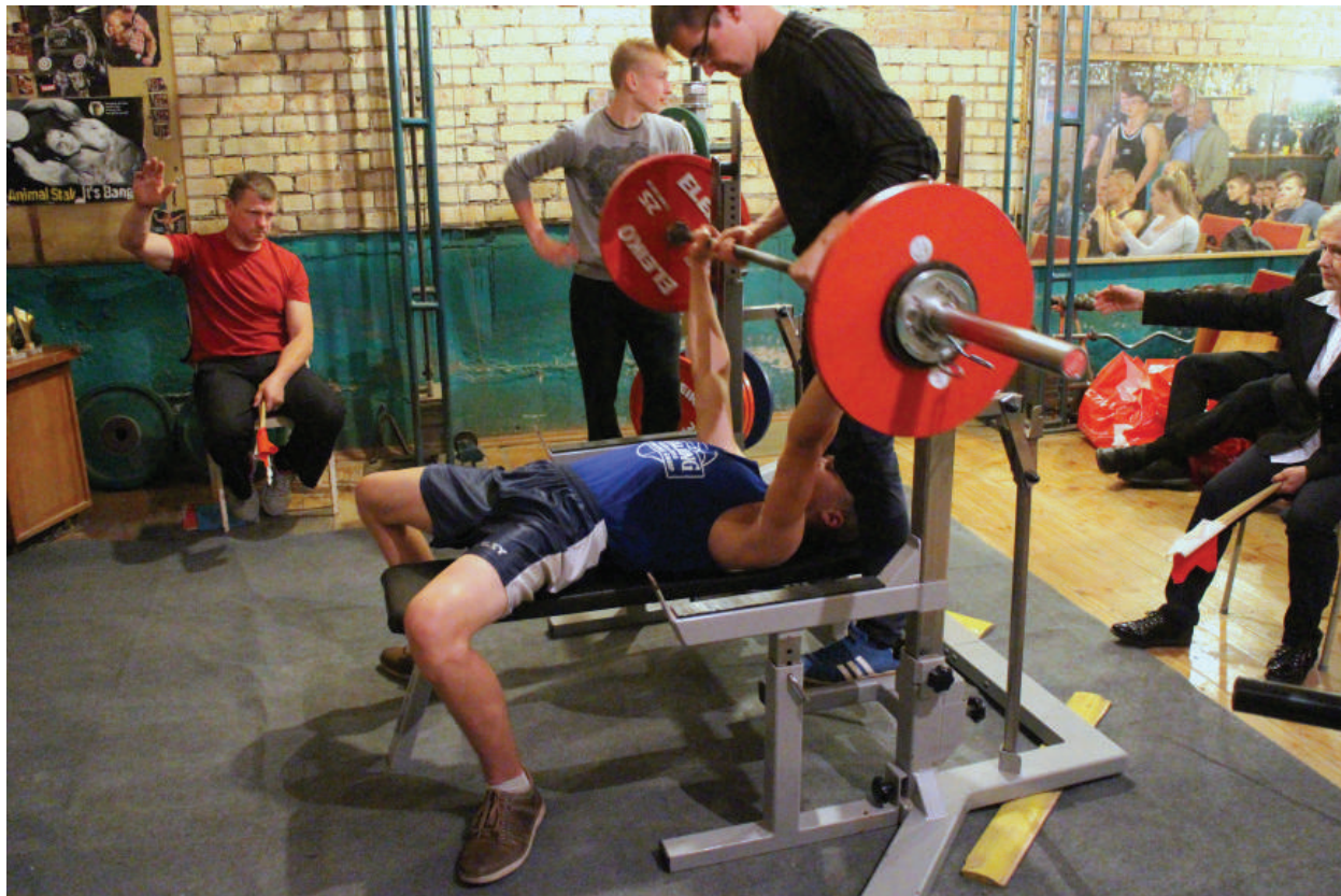
Varžybose dalyvavo 21 atletas.

Praėjusį šeštadienį sporto klubo JTK „Grizlis“ patalpose vyko Rokiškio rajono štangos spaudimo čempionato varžybos (be specialios aprangos). Varžybose užfiksuota nemažai asmeninių ir rajono rekordų.