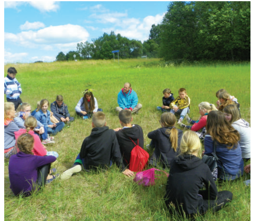
Stovyklos dalyviai klausėsi paskaitos apie sveikatos stiprinimą ir išsaugojimą bei žaidė komandinius žaidimus.