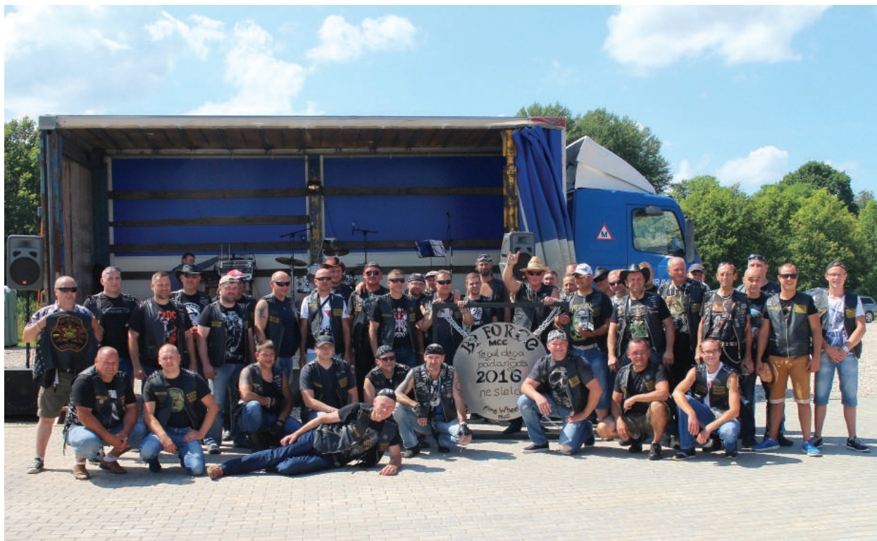
Bendroje nuotraukoje įsiamžino rokiškėnų „By Force“ nariai.

Praėjusį šeštadienį Rokiškio baikerių klubas „By Force“ šventė penkerių metų gimtadienį. Jubiliejaus proga į rokiškėnų baikerių organizuojamą renginį susirinko daugiau 100 baikerių iš įvairiausių Lietuvos kampelių bei kaimyninių šalių.