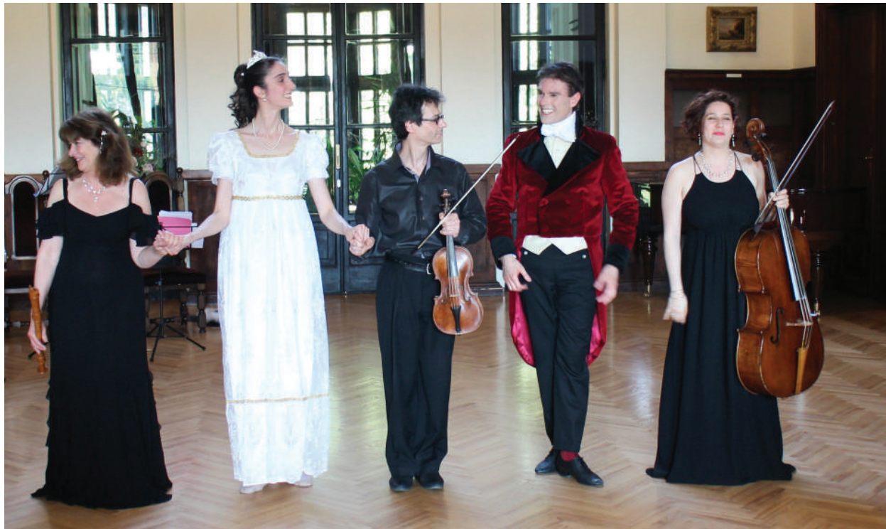
Prancūzų trupė Cie Fantaisies Baroques.

Gaivindami Lietuvos didžiųjų kunigaikščių rezidencijoje gyvavusias kultūrinio gyvenimo tradicijas Valdovų rūmai jau ketvirtus metus iš eilės mini istorinio šokio dieną. Šiais metais Istorinio šokio diena papildė ir Lietuvos muziejų asociacijos rengiamą projektą „Muziejų kelias 2016. Dvarų kultūros atspindžiai“ bei persikėlė į kitus šalies muziejus. Birželio 30 d. istorinis šokis taip pat buvo prisimintas Rokiškio krašto muziejuje.