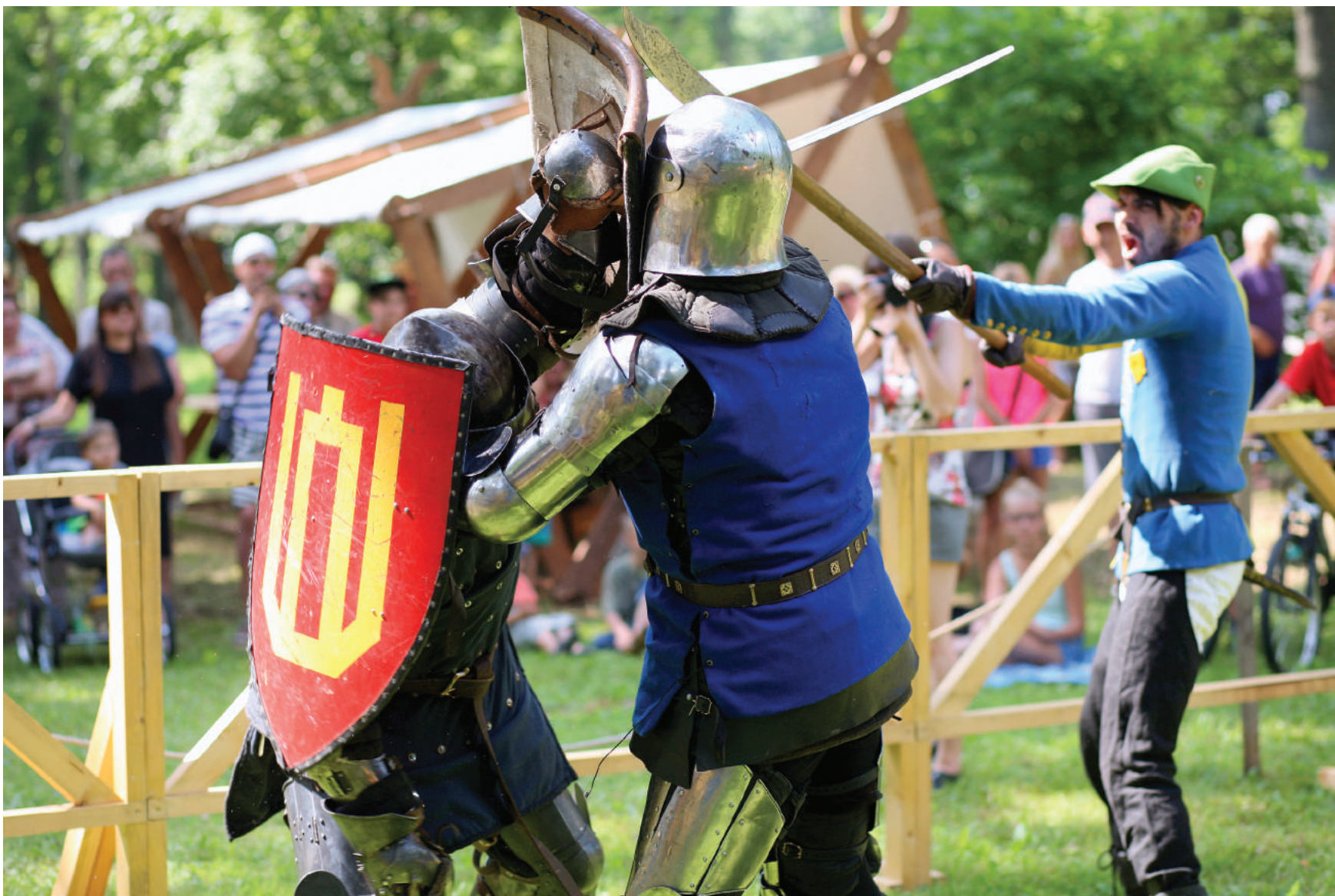
Aršios riterių kovos stingdė susirinkusių rokiškėnų kraują.