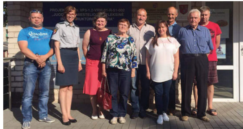
Grupelė policijos rėmėjų talkina pareigūnams.

Policijos rėmėjai talkina pareigūnams masinių renginių, bendruomenės švenčių, įvairių prevencinių akcijų metu. Jie aktyviai dalyvauja saugios gyvenamosios aplinkos kūrime.