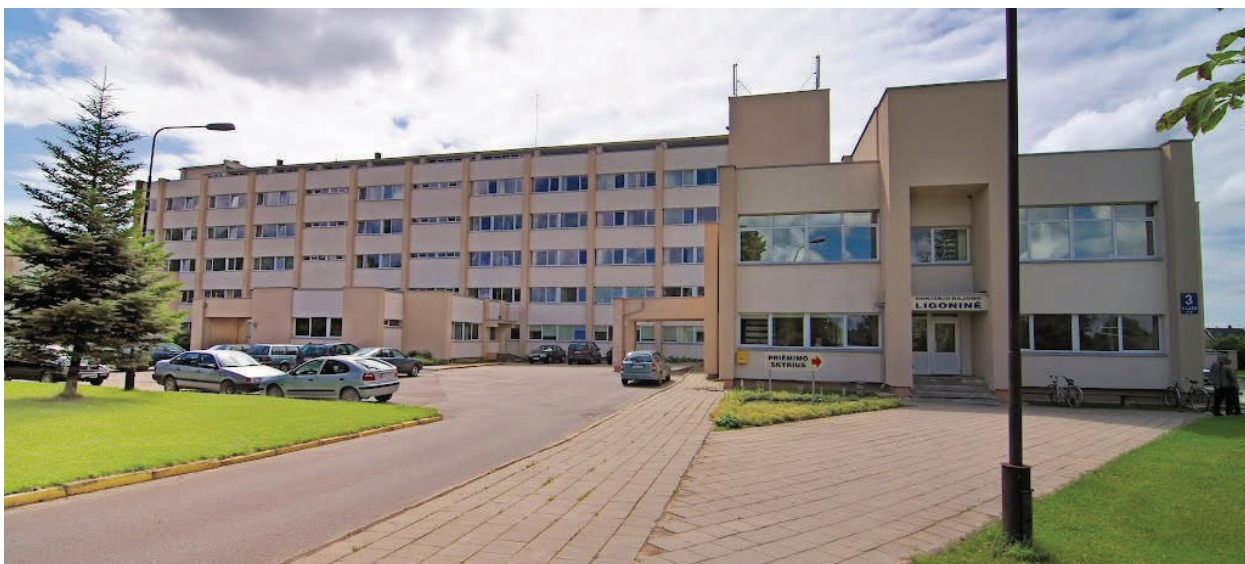
Rokiškio rajono ligoninė.