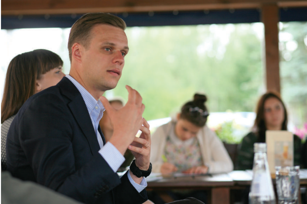
Picerijoje Gabrielius Landsbergis susitiko su jaunimu.

Liepos 4 d. Rokiškyje viešėjo Tėvynės sąjungos-Lietuvos krikščionių demokratų (TS-LKD) partijos pirmininkas Gabrielius Landsbergis. Jaunasis konservatorių vedlys mūsų rajone susitiko su verslininkais, jaunimu ir visuomene, kuriai pristatė „Naują planą Lietuvai“.