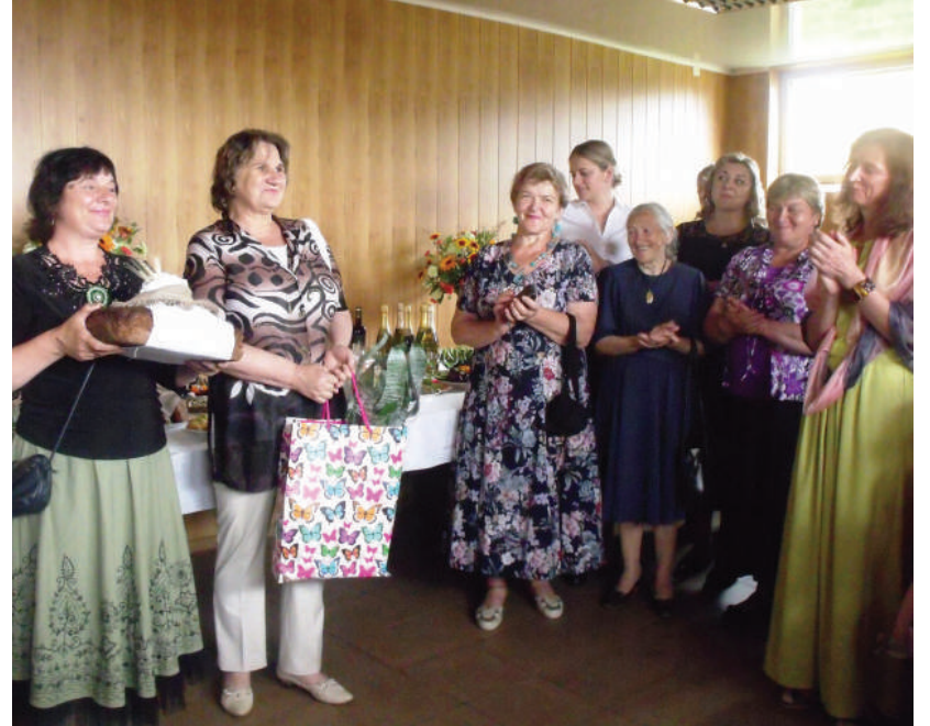
Bendruomenė mėgavosi puikia, ramia švente.

Liepos 3 d. Ragelių km., Jūzintų sen., Rokiškio raj. vyko bendruomenės narių itin laukta Ragelių bendruomenės įkūrimo šventė.