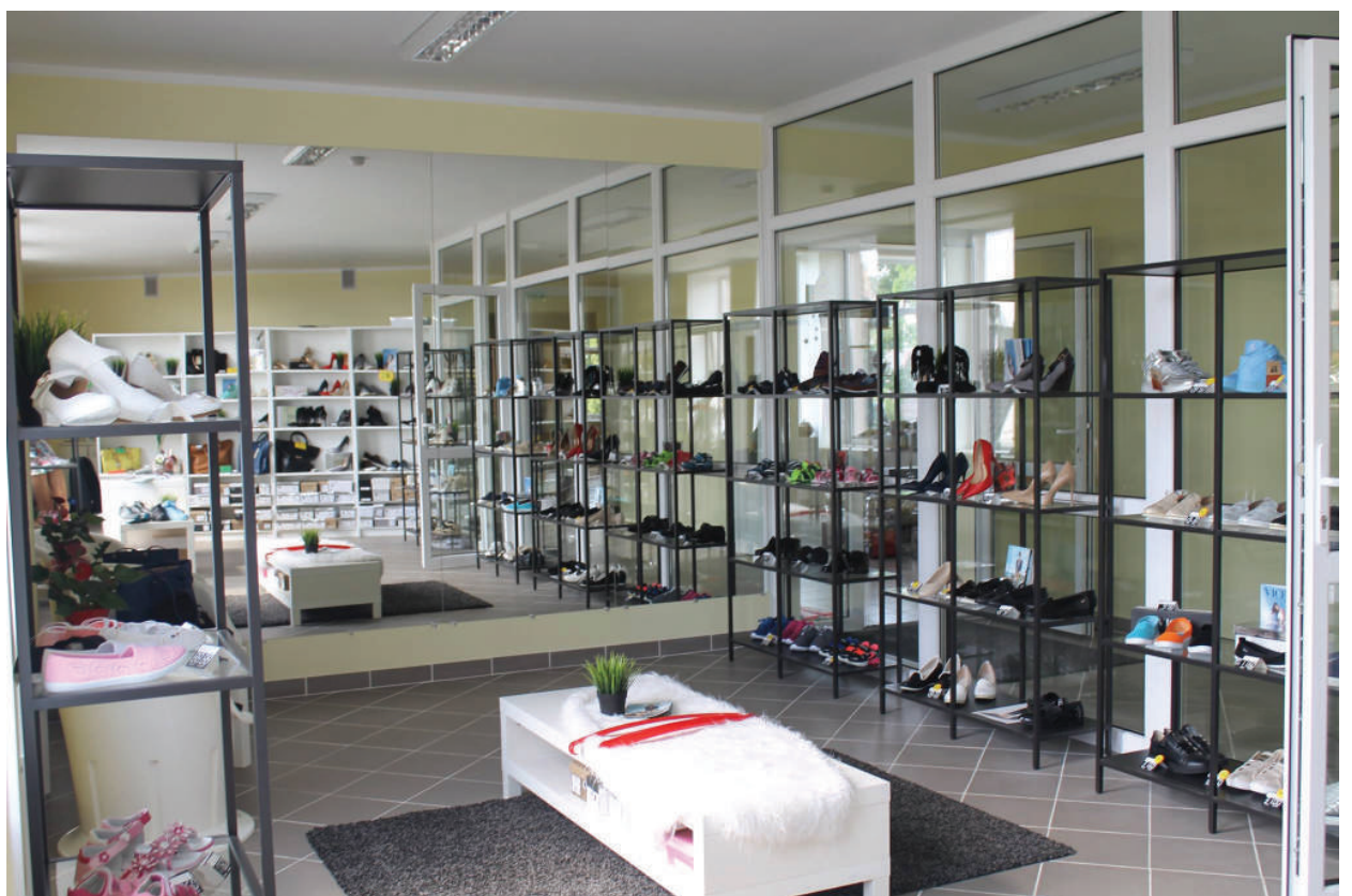
Avalinės parduotuvė „Vices“.