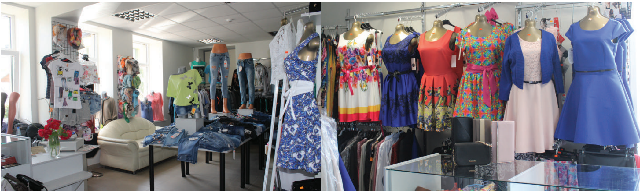
Moteriškų drabužių parduotuvė „Stilingi rūbai“.