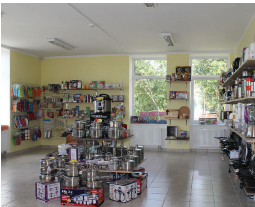
Buities prekių parduotuvė „Prekės namas“.

jūsų pageidavimai ir atsižvelgta į kiekvieno asmeninius poreikius, konsultantė padės išsirinkti tinkamiausių batų porą, todėl galite jaustis lyg patekę į „batų rojų“. Čia galite rasti sezono topų – laisvalaikio batų su auksinėmis, sidabrinėmis detalėmis, lengvų, patogių, vasariškų batų kasdienai ir žvilgsnį pritraukiančių ryškių ir kūno spalvos – visada madingų aukštakulnių, su kuriais galėsite žengti ir raudonu kilimu. Vasara dar neįpusėjo, todėl basučių pasirinkimas itin platus (papildymys) – net ir įnoringos klientės ras sau patinkančią batų porą. Prekių asortimentas dažnai papildomas ir šiuo metu taikomos ypatingos nuolaidos rudens kolekcijai. Jeigu mėgstate ruošti šaltesniam sezonui iš anksto - laisvalaikio ir kietiems