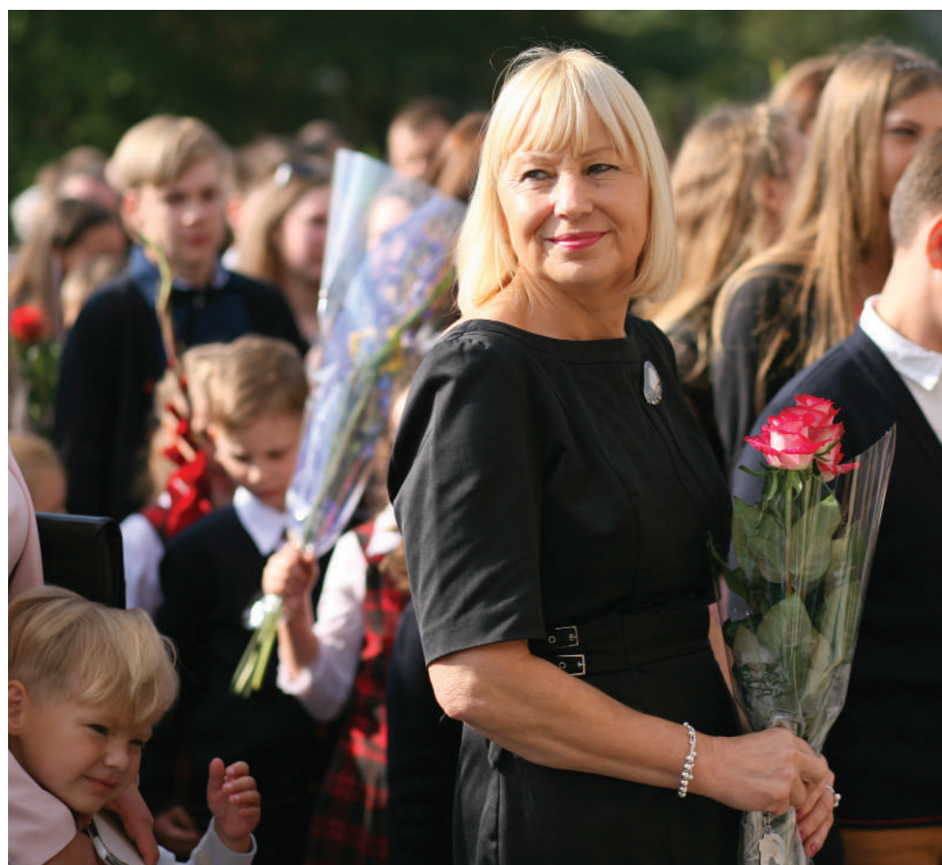
Rugsėjo 1 – osios akimirkos.