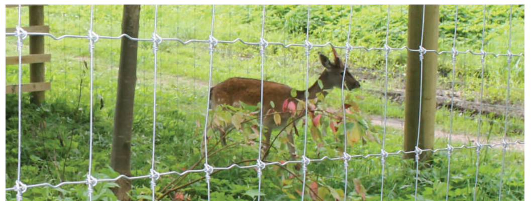
Lankytojams jau pasirodė pirmasis elnias.