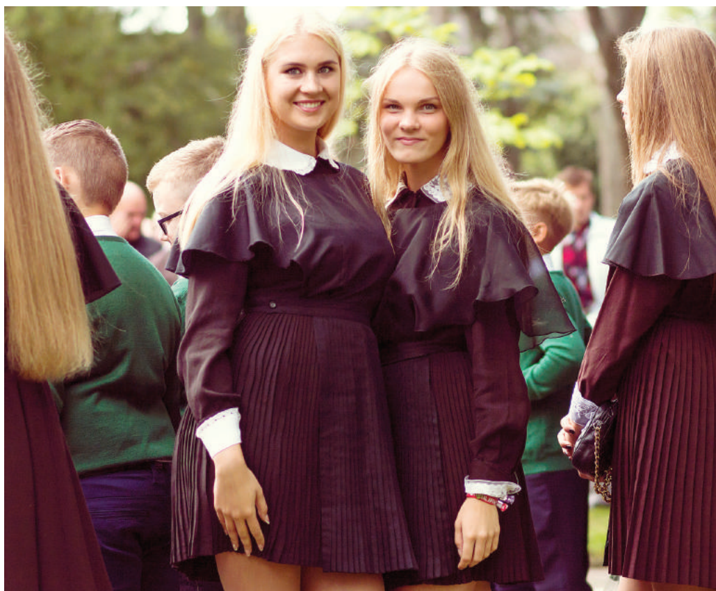
J. Tumo-Vaižganto gimnazijos abiturientės pasipuošė uniforma.