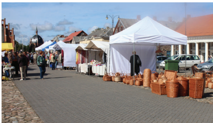
Gyventojus į miesto aikštę sukvieta mugė.

Rugsėjo 6-8 dienomis Rokiškio miesto centre šurmuliavo tautodailės ir amatų mugė. Žmonės ne tik galėjo pasigėrėti autentiškais gaminiams, bet ir isigyti įvairiausių rankų darbo gaminių, kepinių bei augalų: skarelių, pintų krėslų ir krepšių, lininių drabužių, medinių namų apyvokos daiktų, šviežių kepinių bei įvairiausių sodinukų.