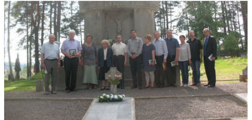
Kultūros darbuotojų delegacija Červonkoje prie monumento žuvusiems 1919–1920 m. Lietuvos kariams.