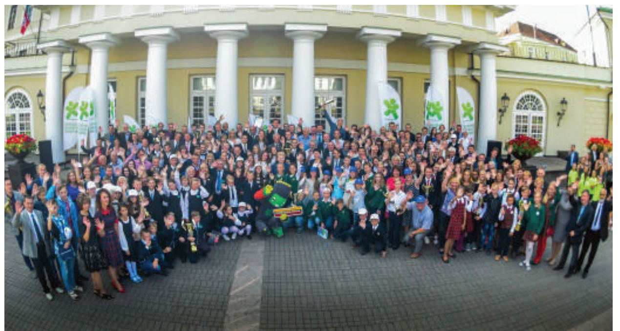
Prezidentūros kiemelyje – Lietuvos mokyklų žaidynių apdovanojimai.