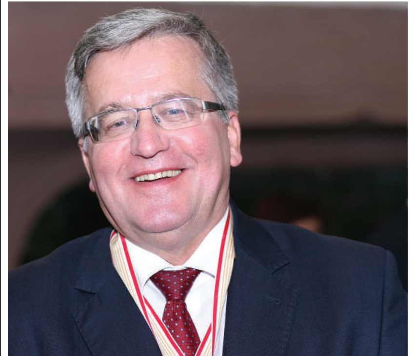
Kadenciją baigęs Lenkijos Prezidentas Bronislavas Marija Komorovskis.

Rugsėjo 16 – 17 dienomis Rokiškyje vyks Lietuvos – Lenkijos smulkaus ir vidutinio verslo bei turizmo regioninė konferencija. Į konferenciją žada atvykti daug garbingų svečių - verslininkų ir politikų. Bene garbiausias svečias Rokiškyje - kadenciją baigęs Lenkijos Prezidentas ir Rokiškio krašto garbės pilietis Bronislavas Marija Komorovskis.