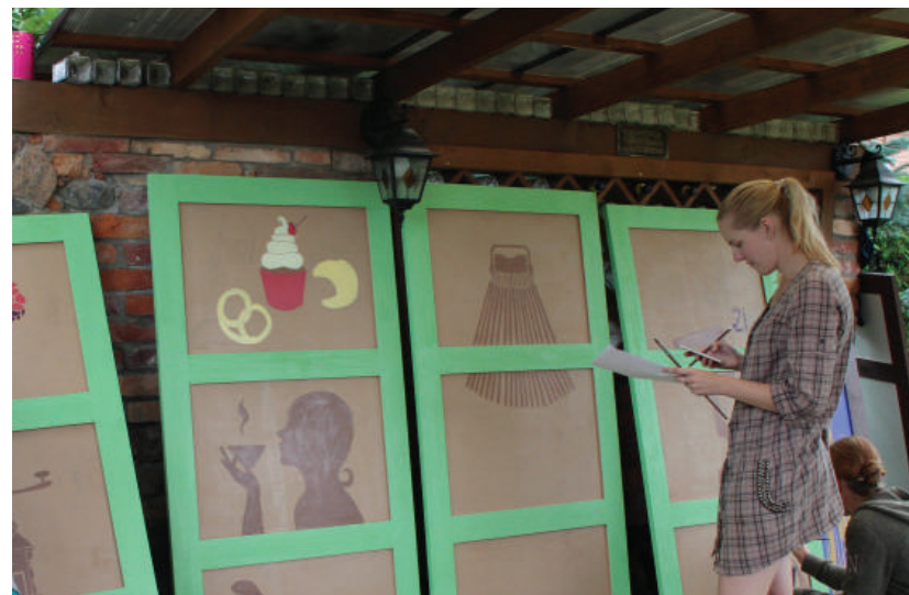
Vykusio plenero akimirksnis.