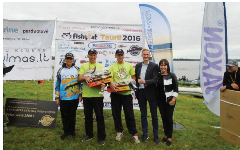
„Auksinės starkės“ klubo komanda.

Rugsėjo 17 d. Sartų ežere vyko „VII-ojo atviro Spiningavimas.lt“ čempionato IV-asis etapas, kuriame dalyvavo net 6 Rokiškio rajono žvejų klubų komandos, po 2 žmones valtyje: „Auksinio starkio“ klubui atstovavo 4 komandos, „Megalodono“ klubui – 2.