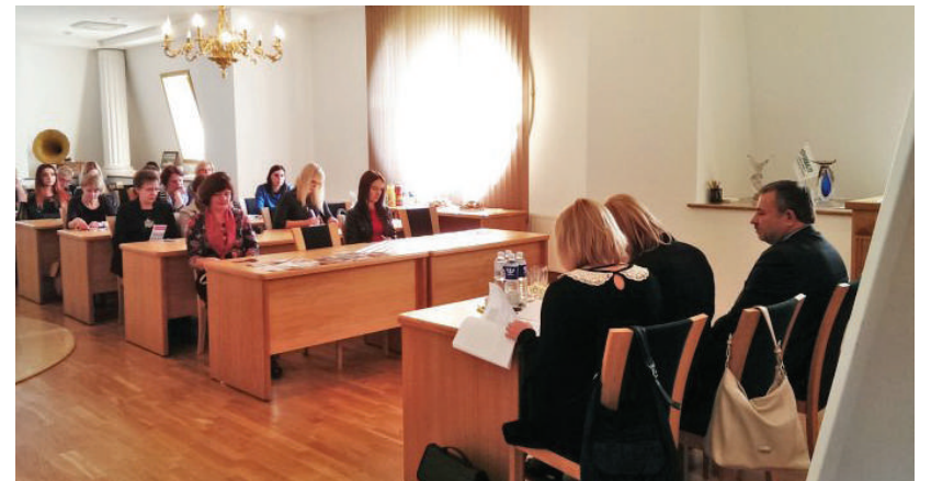
Tikimasi, kad naujai užsimezges bendradarbiavimas bus tęstinis.

Siekiant sudaryti galimybę kuo patogiau bendrauti su „Sodra“, rugsėjo 19 d. Rokiškio verslo klube vyko Valstybinio socialinio draudimo fondo valdybos Panevėžio skyriaus specialistų susitikimas su klubo narių darbuotojais.