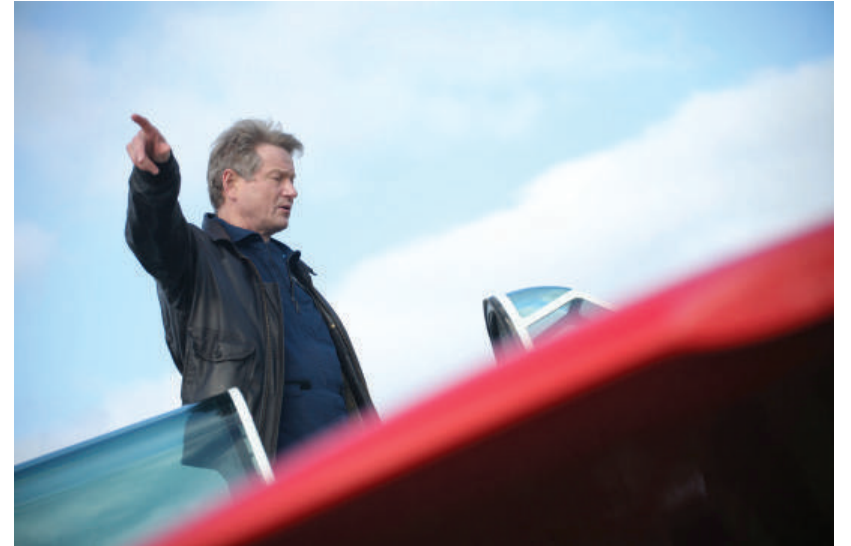
Už grupės padėtį danguje atsakė Rolandas Paksas.

Praėjusį sekmadienį rokiškėnai rinkosi į Krašto muziejaus erdves. Čia vyko dvaro piknikas, kurį vainikavo Lietuvos akrobatinių skrydžių grupės pasirodymas „Sparnas prie sparno“.