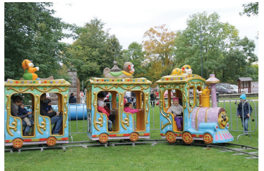
Miesto gimtadienis - dviguba šventė vaikams.

Rokiškio miesto gimtadienis - dviguba šventė vaikams. Rokiškio krašto muziejaus parko erdvės tryško nuo vaikų juoko ir džiaugsmo. Daug vaikų susirinko į teatralizuotą programą „Rokiškio sūris – Rokiškio vaikams“.