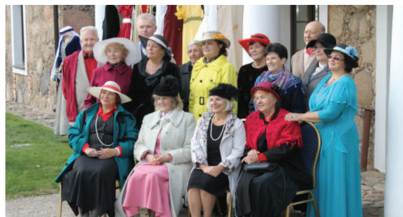
Įspūdingais kostiumais pasipuošę šventės dalyviai.