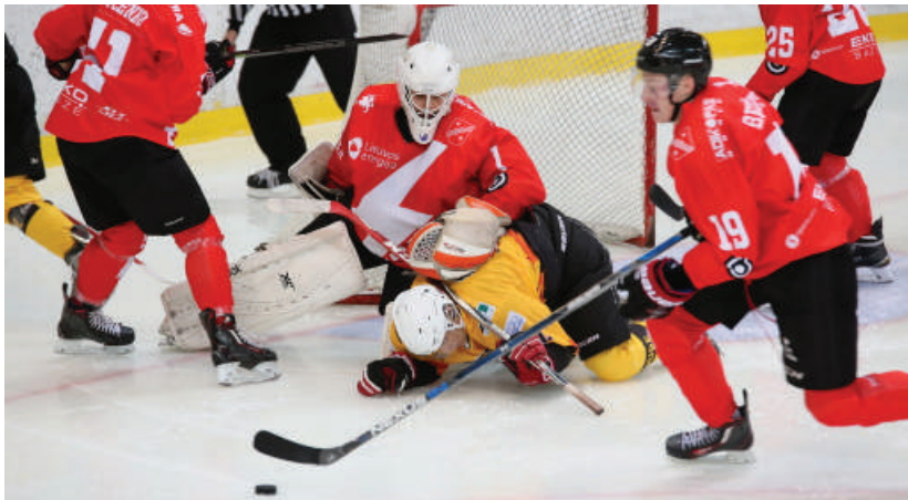
Lygi ir atkakli kova vyko iki pat varžybų pabaigos.