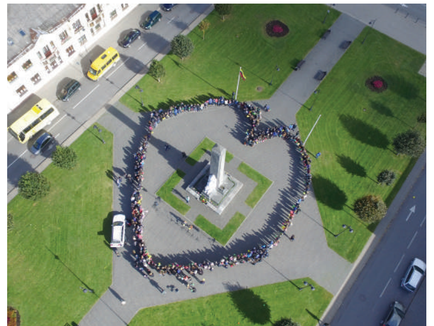
Jaunimas susikabino rankomis ir širdies forma apjuosė paminklą.

Spalio 4 d. Rokiškio jaunimas rinkosi prie Nepriklausomybės paminklo, kur gražia akcija paminėjo šio laisvės simbolio 85 metų pastatymo sukaktį.