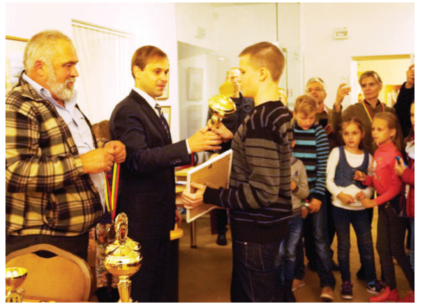
Šachmato turnyro apdovanojimų akimirka.