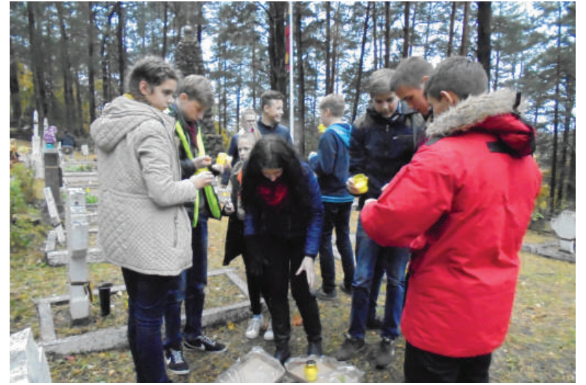
Akcija „Gėlių žiedai žuvusiems Lietuvos savanoriams ir partizanams“.