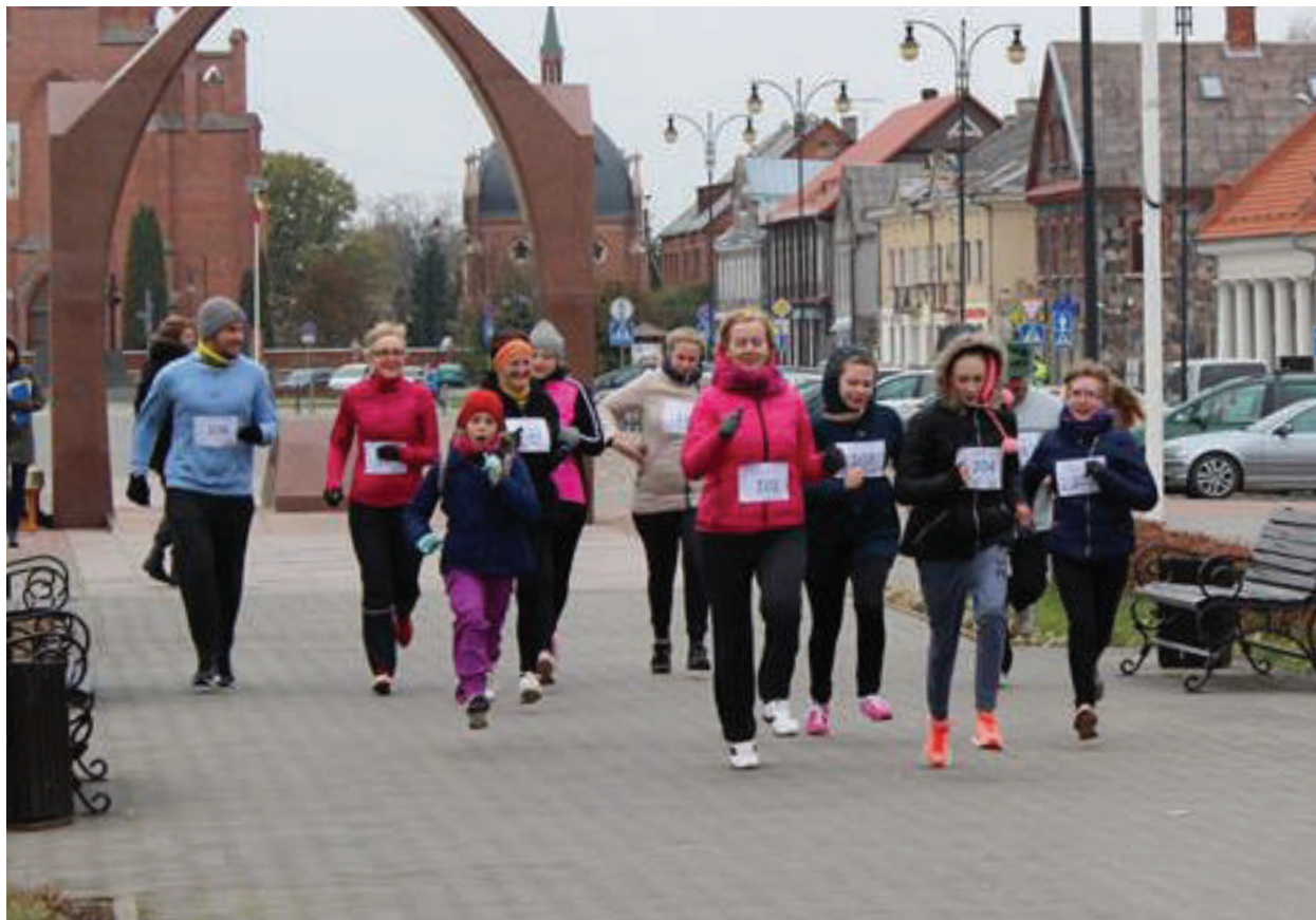
Beveik šimtas dalyvių bėgo savo pasirinktą atstumą.

Spalio 22 d. Rokiškyje pirmą kartą vyko bėgimas, organizuojamas Jaunųjų Lyderių klubo. Beveik šimtas dalyvių bėgo savo pasirinktą atstumą (1km, 3km, 6km, 9km, 12km) už kiekvieną iš emigracijos grįžusį žmogų. „Į Lietuvą per 2015 metus grįžo 23643 asmenys. Kad būtų lengviau įsivaizduoti, tai daugiau nei pusantro Rokiškio. Taigi, už kiekvieną jauną ir žilą galvą, už kiekvieną žemą ir aukštą kūną mes bėgome metrus ir kilometrus. Parodėme, jog mums čia gyventi gera ir mes laukiame visų“, – pasakojo organizatoriai.