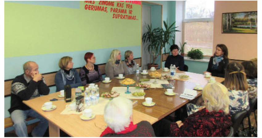
Susitikime savo patirtimis ir išgyvenimais dalinosi neįgalieji.

Spalio 25 d. Rokiškio rajono Neįgaliųjų draugijoje vyko Rokiškio savivaldybės Neįgaliųjų reikalų prie Rokiškio rajono savivaldybės tarybos posėdis. Į posėdį buvo pakviesti ir rajono neįgalieji, dalyvaujantys Socialinės rehabilitacijos paslaugų bendruomenėje projektų veikloje.