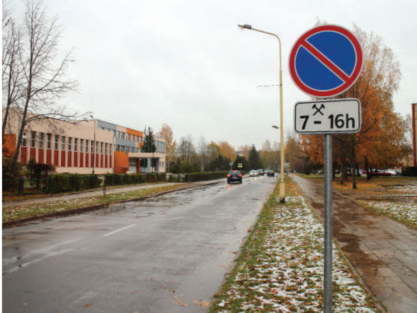
Naujas kelio ženklas informuoja, jog palikti ilgam savo automobilius draudžiama darbo dienomis nuo 7 val. ryto iki 16 val. dienos.