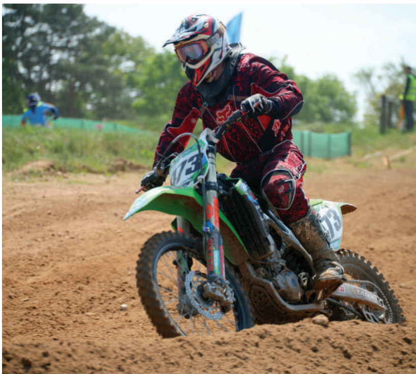
Paskutinis „Rokiškėnų taurė – 2016“ etapas uždarė motokroso sezoną.

Primename, kad liepos 17 d. vykusioje „Rokiškėnų taurės“ IV-ajame