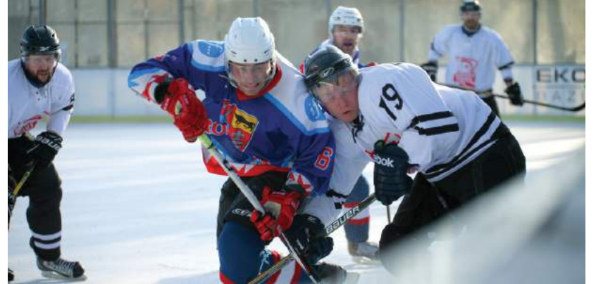
Rokiškėnams ledo ritulio čempionato startas yra ne itin sėkmingas.