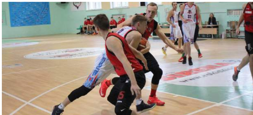
„Fenikso“ ekipa, palaikoma savų sirgalių, žaidžia itin sėkmingai.

Praėjusį savaitgalį Natural Pharmaceuticals-Regionų krepšinio lygos (RKL) sezono dar dvi rungtynės sužaidė RSK „Fenikso“ ekipa. Vienos jų paženklintos pralaimėjimu, kitos - pergale.