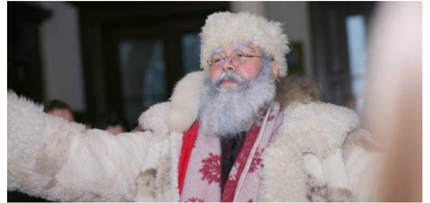
Lapkričio 26 d. 17 val. įvyks grandiozinė Senelio Kalėdos rezidencijos atidarymo šventė.

Vis dažniau žemę nukloja puraus sniego sluoksnis – artėjančios žiemos ir Šv. Kalėdų pranašas. Kad šis šventinis laukimas neprailgtų, o taptų stebuklingas, magiškas ir kupinas geriausių emocijų ir nuotaikų, Rokiškio verslo klubo idėja Rokiškio krašto muziejų paversti Senelio Kalėdos rezidencija materializavosi – jau lapkričio 26 d. 17 val. įvyks grandiozinė Senelio Kalėdos rezidencijos atidarymo šventė. Šis didžiulis projektas nėra vienkartinis ir skirtas visos Lietuvos vaikams ir šeimoms. Tikimasi, kad jis turės tęsinį ir Rokiškis taps lietuviškąja Laplandija, juk ir gyvename Lietuvos šiaurėje.