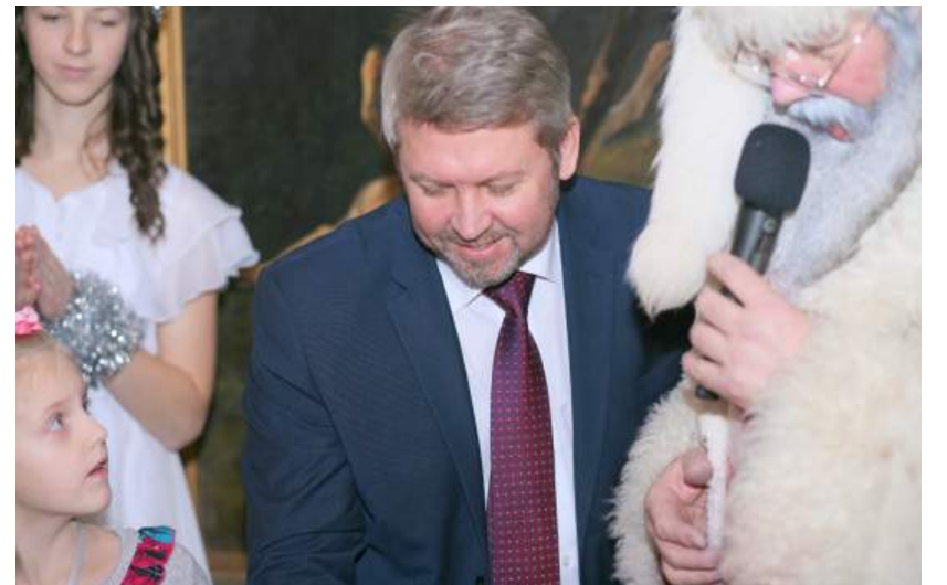
Senelio Kalėdos rezidencija dirbs miestui ir suteiks džiaugsmo jo žmonėms.

sutartimi, pats tapau Senelio Kalėdos rezidencijos ambasadoriumi. Todėl jaučiu didelę atsakomybę ir pareigą šią žinią apie Rezidenciją skleisti tarptautiniu lygmeniu bendradarbiaujant su užsienio ambasadoriais, Užsienio reikalų ministerija, viešbučių asociacijomis, kitų miestų merais. Lapkričio 15 d. lankysiuosi Latvijos ambasadoje, kur bus minima Latvijos Nepriklausomybės diena. Ten taip pat informuosiu ir kviesiu atvykti. Didžiuokimės ir plačiai skliskime žinią apie Rokiškį, virsiantį lietuviška, tačiau kartu ir egzotiška Laplandija.