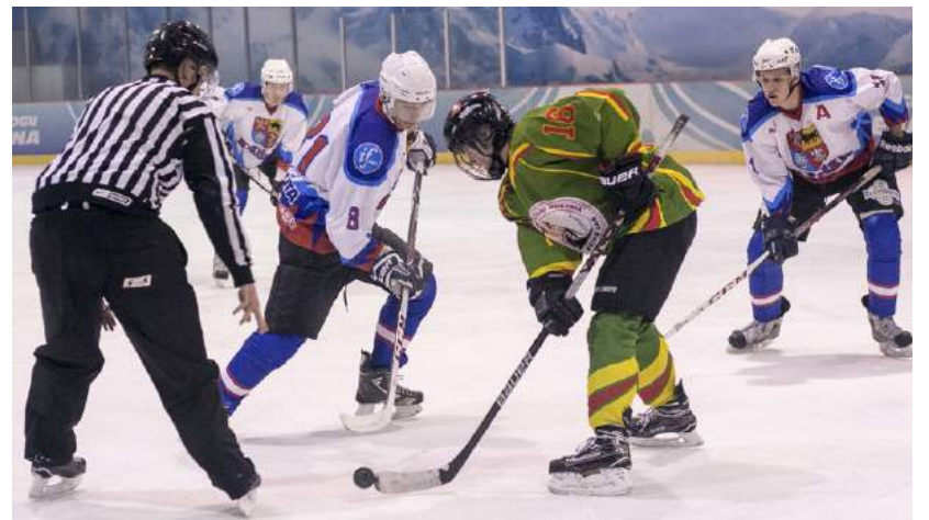
Šiose varžybose rokiškėnai atsirevanšavo Vilniaus „Geležinio vilko“ ekipai už pralaimėjimą spalį.

Šį sezoną Lietuvos ledo ritulio čempionate banguotai žaidžianti „Rokiškio“ ekipa lapkričio 12 d. svečiuose rezultatu 4:0 „sausai“ nugalėjo šeimininkus Vilniaus „Geležinio vilko“ ledo ritulininkus.