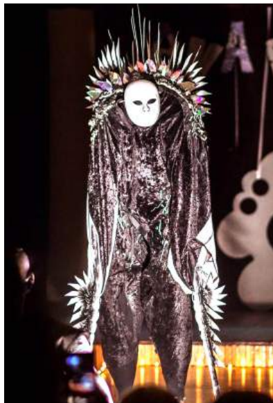
Scenoje buvo pristatyta daugiau nei 15 kolekcijų.