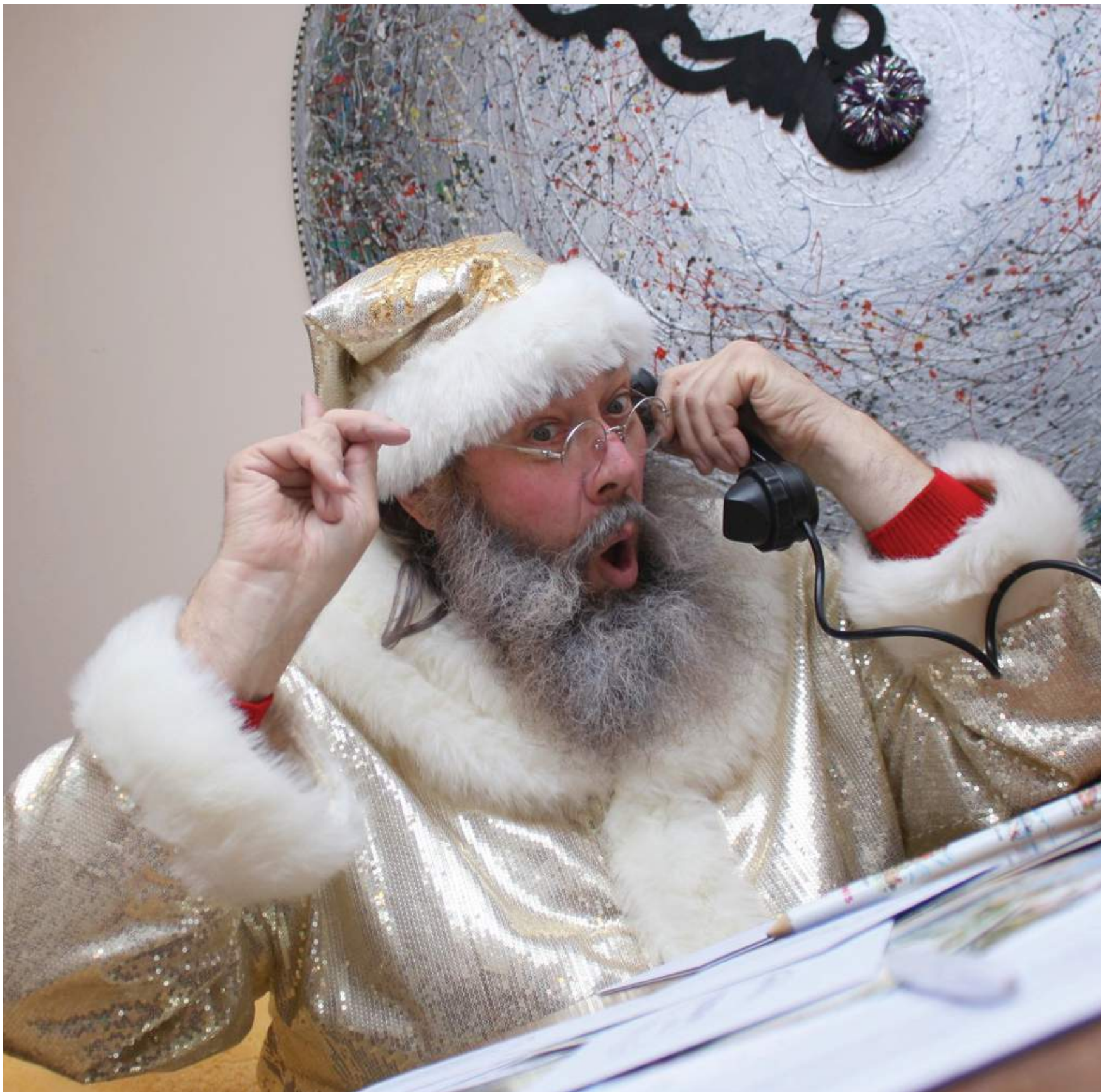
Lapkričio 26 d. 17 val. įvyks grandiozinė Senelio Kalėdos rezidencijos atidarymo šventė.