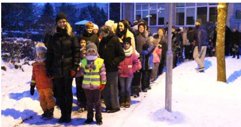
Atšvaitais pasipuošę darželio auklėtiniai žygiavo prevencinėje eisenoje.

Visi turėjo prisisekę atšvaitus ir keliavo nuo mokyklos-darželio „Ažuoliukas“ link prekybos centro „Maxima“. Vakarą tamsoje pasklidusios švieselės tarsi bylojo: aš – saugus. Vaikai jautėsi tikrais eismo dalyviais, o pokalbiai prie šviesoforo