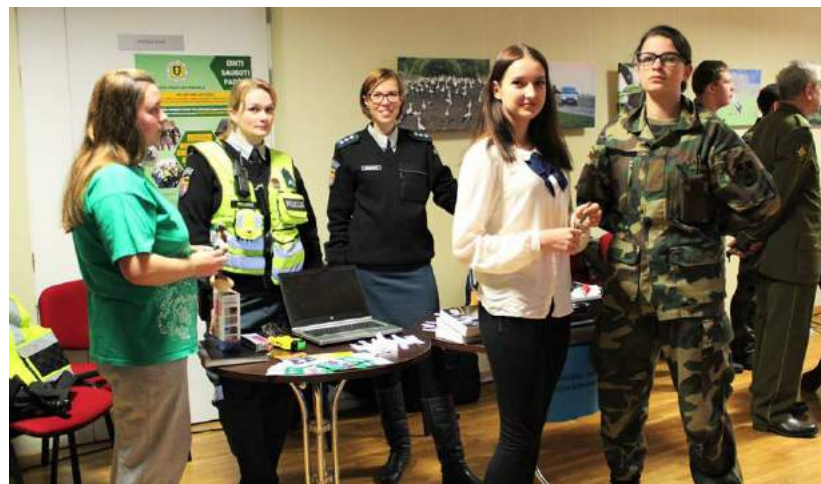
Renginys buvo skirtas paminėti Pasaulinę jaunimo dieną.

Lapkričio 11-ą dieną Rokiškio Jaunųjų lyderių klubas surengė įvairiausių įmonių, įstaigų ir organizacijų mugę „Realizuok save Rokiškyje“. Renginys buvo skirtas paminėti Pasaulinę jaunimo dieną.