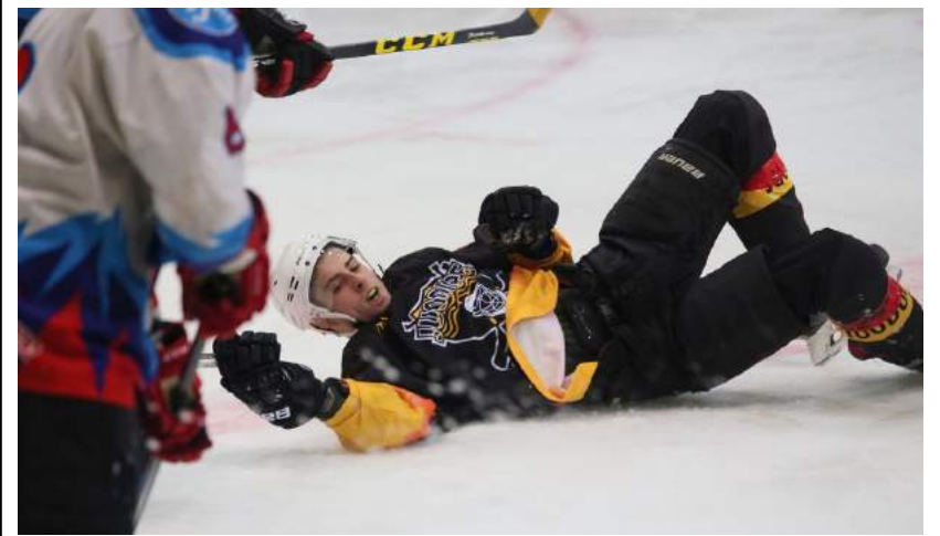
Atkakli kova vyko iki paskutinės varžybų sekundės.

Lapkričio 15 d. Elektrėnuose Lietuvos ledo ritulio čempionato varžybose susitiko dvi mūsų krašto komandos – Juodupės „Juodupė“ ir Rokiškio „Rokiškis“. Po itin atkaklios kovos ir baudinių serijos pergalę rezultatu 3:2 šventė juodupėnai.