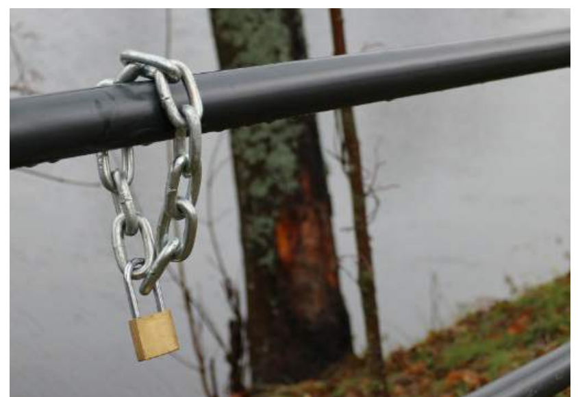
Dvaro alėjoje jaunavedžiai pakabino meilės simbolį.