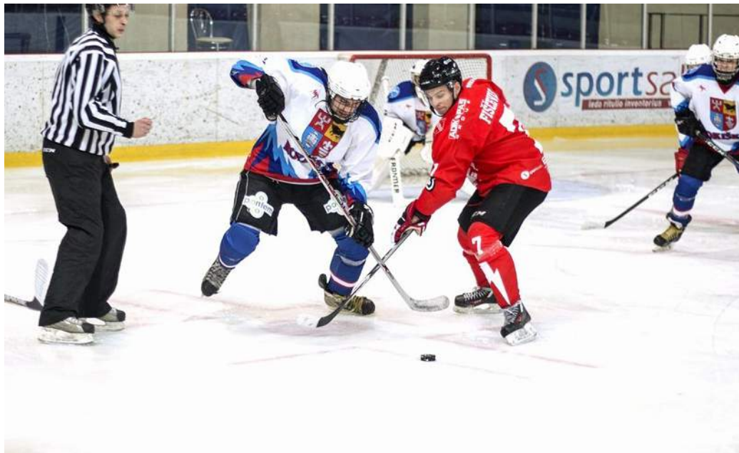
„Rokiškis“ šį sezoną demonstruoja nepastovų žaidimą.

Lapkričio 30 d. Lietuvos ledo ritulio čempionate Rokiškio „Rokiškis“ susitiko su lyderiais Elektrėnų „Energija“ ir pralaimėjo rezultatu 2:5. Elektrėniškiai nugalėję rokiškėnus dar labiau įtvirtino savo pozicijas pirmoje turnyrinės lentelės vietoje.