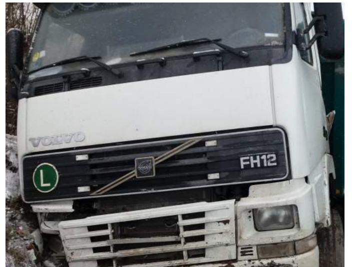
Šio sunkiasvorio vairuotojui pasisekė – jis liko sveikas.

Iškritęs sniegas vėl sutrikdė eismą, o slidžiuose keliuose pasipylė avarijos.