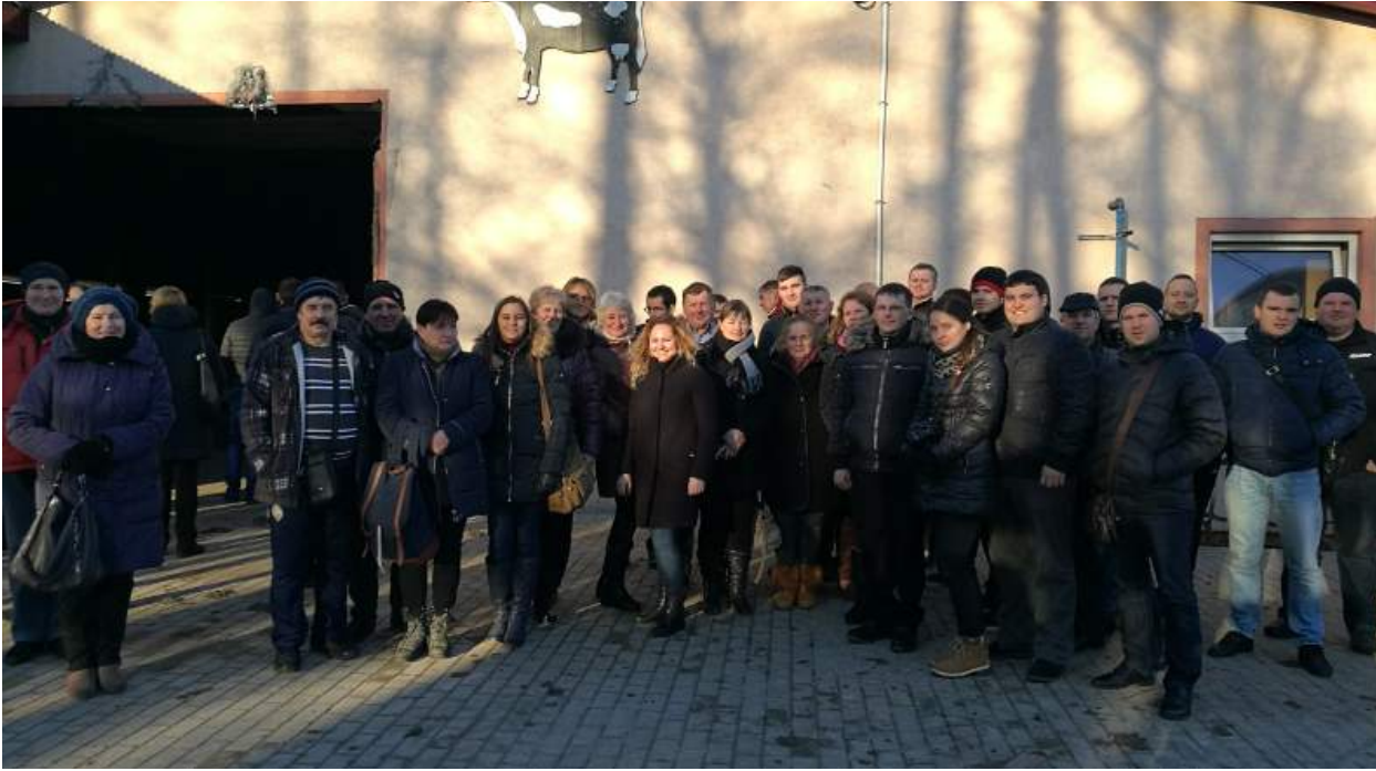
Žemės ūkio parodoje Lenkijoje lankėsi ir gausi Rokiškio rajono ūkininkų delegacija.

Lapkričio 25-27 d. Lenkijoje vyko tarptautinė Centrinė žemės ūkio paroda. Paroda vyko Tarptautiniuose parodų ir kongresų rūmuose PTAK WARSAW EXPO, Nadažyno (lenk. Nadarzyn) mieste. Parodoje buvo galima pamatyti įvairiausių techniką, gyvulius, paukščius, naudojamus papildus, trąšas. Į šį renginį išvyko ir gausi delegacija Rokiškio rajono ūkininkų – važiavo 55 kraštiečiai.