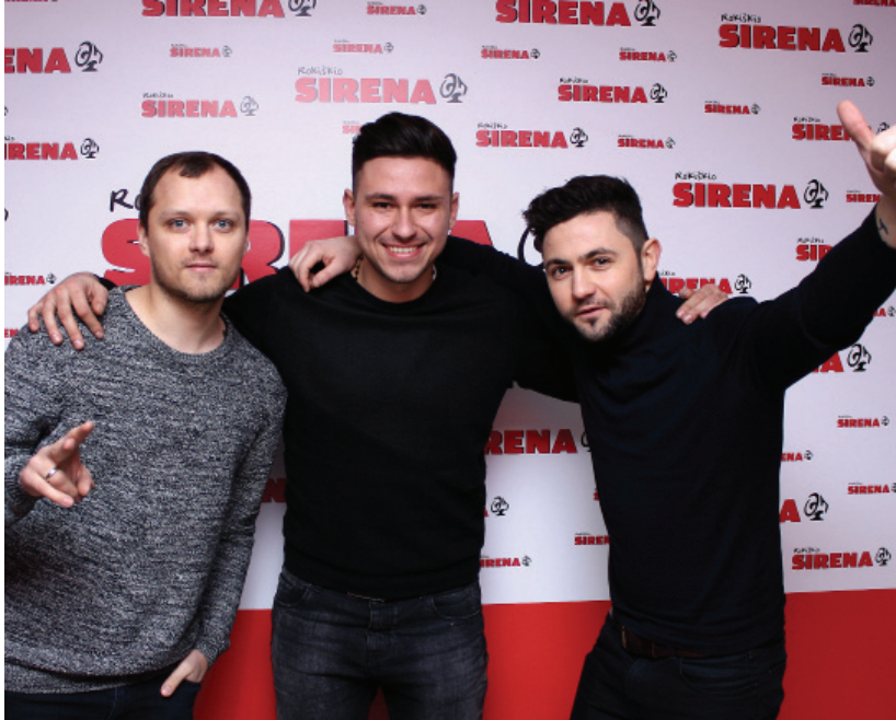
Rokiškėnus ir miesto svečius linksmino grupė „Pikaso“.

je buvo įžiebta per lietuviškojo Senelio Kalėdos rezidencijos atidarymo šventę.