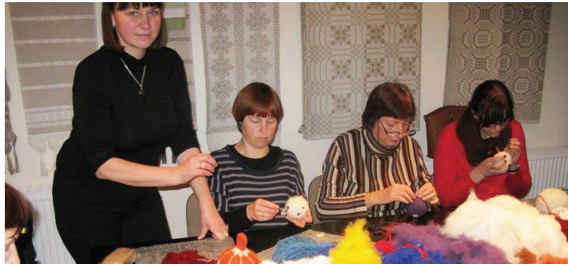
Kiekvienas dalyvis pasigamina po originalų žaisliuką.

Į edukaciją susirinko gausus būrys dalyvių, kuriems rūpėjo pasidaryti rankų darbo žaisliukų eglutei papuošti. Edukacija truko apie 3 val. Paruoštą pagrindą atsivežė pati tautodailininkė, o visą fantaziją pasitelkę dalyviai vėlė žaisliukus iš UAB „Lanalita“ vilnos. O kokia įvairovė ir kiek daug būdų papuošti savo žaisliukus. Juos puošė ornamentais, brūkšneliais, taškeliais, snaigėmis, buvo papuošta net gaidžio atvaizdu, žinant, kad kiti metai ugningo gaid-