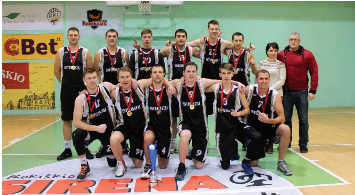
Turnyro finale triumfavo „Entuziastų“ komanda.

Gruodžio 18 d. baigėsi kalėdinis vyrų krepšinio turnyras, skirtas rajono laikraščio „Rokiškio Sirena“ taurėi laimėti. Gerą pusdienį Rokiškio kūno kultūros ir sporto centre vyko net trejos rungtynės, o paskutinėmis išaiškėjo turnyro nugalėtojai. Jais tapo „Entuziastai“, kurie po itin atkaklios kovos nugalėjo Sporto centro auklėtinius.