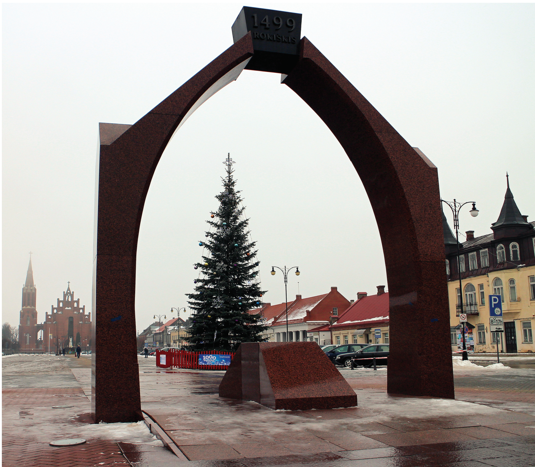
Rokiškėnai pripažino, jog Kalėdų eglutė nors ir kukli, bet graži.