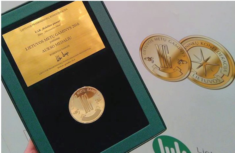
Aukso medalį UAB „Rokiškio pienas“ pelnė sūris „Mozzarella“

Konkurso „Lietuvos metų gaminy“ pagrindinis tikslas – didinti aukštos kokybės lietuviškos produkcijos konkurencingumą, pristatyti ir įtvirtinti šalies pramonės produkciją, prekes ir paslaugas vietiniam ar tarptautiniam vartotojui, skatinant rinktis kokybišką lietuvišką produktą, taip vystant Lietuvos verslo plėtrą.