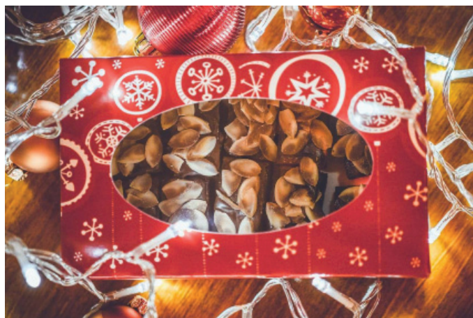
„Kavinė Pupelė“ galite įsigyti saldžių dovanėlių.