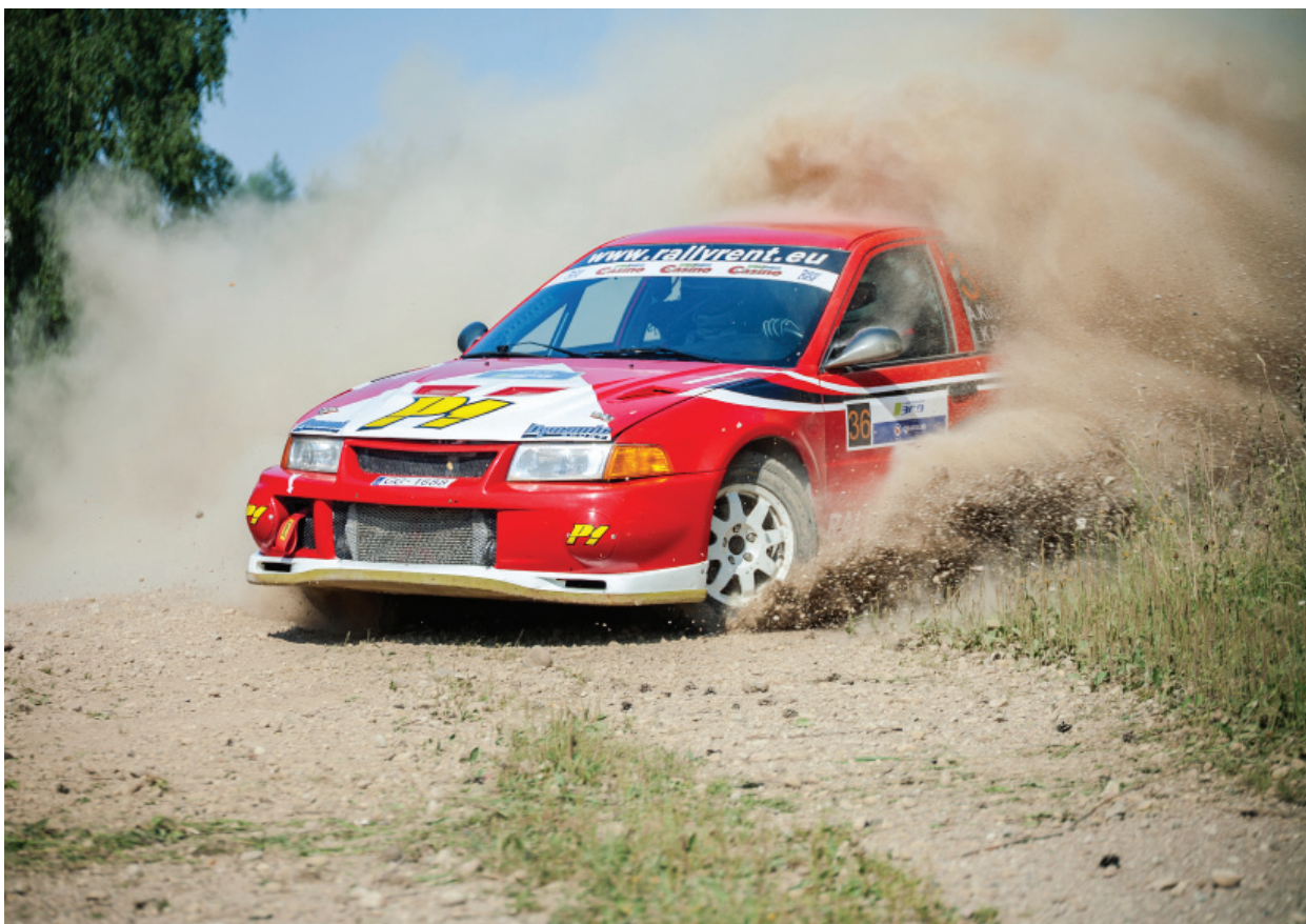
Lenktynėse varžosi greičiausi Baltijos šalių bei užsienio lenktynininkai.