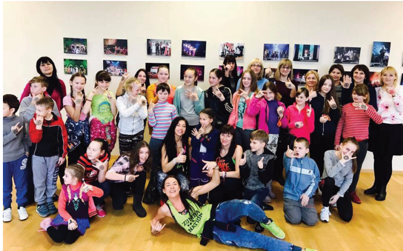
Renginyje vaikams neteko nuobodžiauti – jie piešė, spalvino ir šoko ZUMBA ritmu.

Gruodžio 21 d. Rokiškio rajono savivaldybės vaiko teisių apsaugos skyrius organizavo renginį vaikams, kuriame dalyvavo gausus būrys dalyvių.