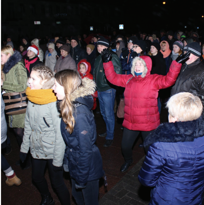
Artėjant vidurnakčiui linksmybės persikėlė į Nepriklausomybės aikštę.

Laikrodžiams mušant 24 val. dangų nušvietė įspūdingi fejerverkai, kuriuos rokiškėnams dovanojo Rokiškio miesto seniūnija.