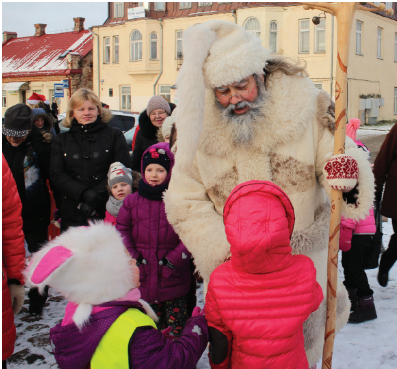
Aikštėje Senelis Kalėda sulaukė didelio vaikų dėmesio.

Po nuotaikingo apsilankymo miesto centre Senelis Kalėda nuskubėjo į Obelius, kur savo vizitu bei dovanomis pradžiugino ir Obelių savarankiško gyvenimo namų gyventojus.