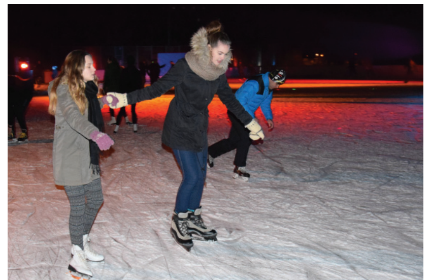
Rokiškėnai iki sutemos ant ledo linksmai leido laiką.

Gruodžio 28 d. Rokiškio sporto klubas „Feniksas“ pakvietė rokiškėnus ledo aikštelėje smagiai praleisti laiką skambant muzikai.