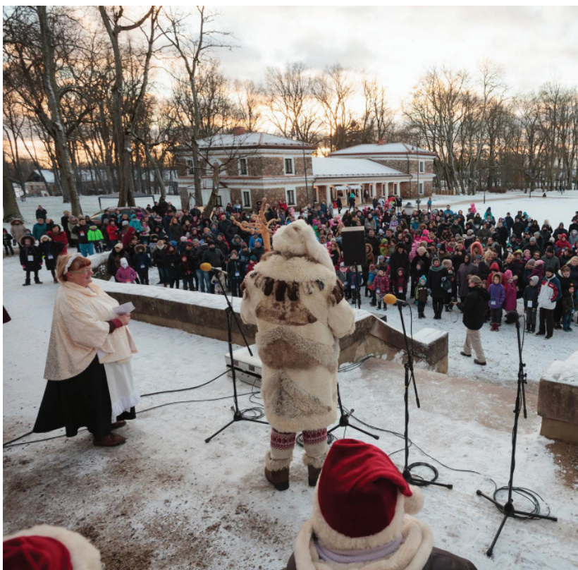
Daugiau nei 400 vaikų atvyko susitikti su Vyriausiuoju Kalėdų Seneliu.