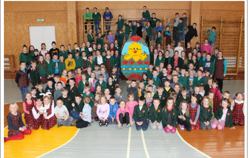
Šventės akcentas – 2 metrų aukščio ir 1 metro pločio margutis.