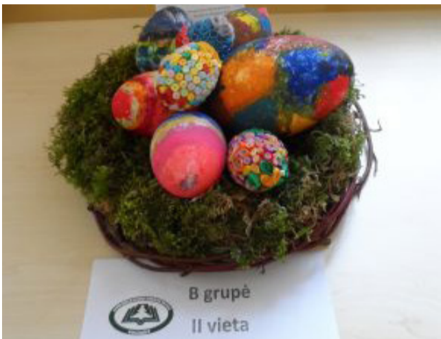
B grupė II vieta