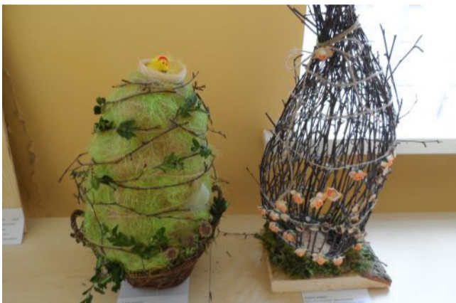
Kamajiškių moksleivių darbeliai.