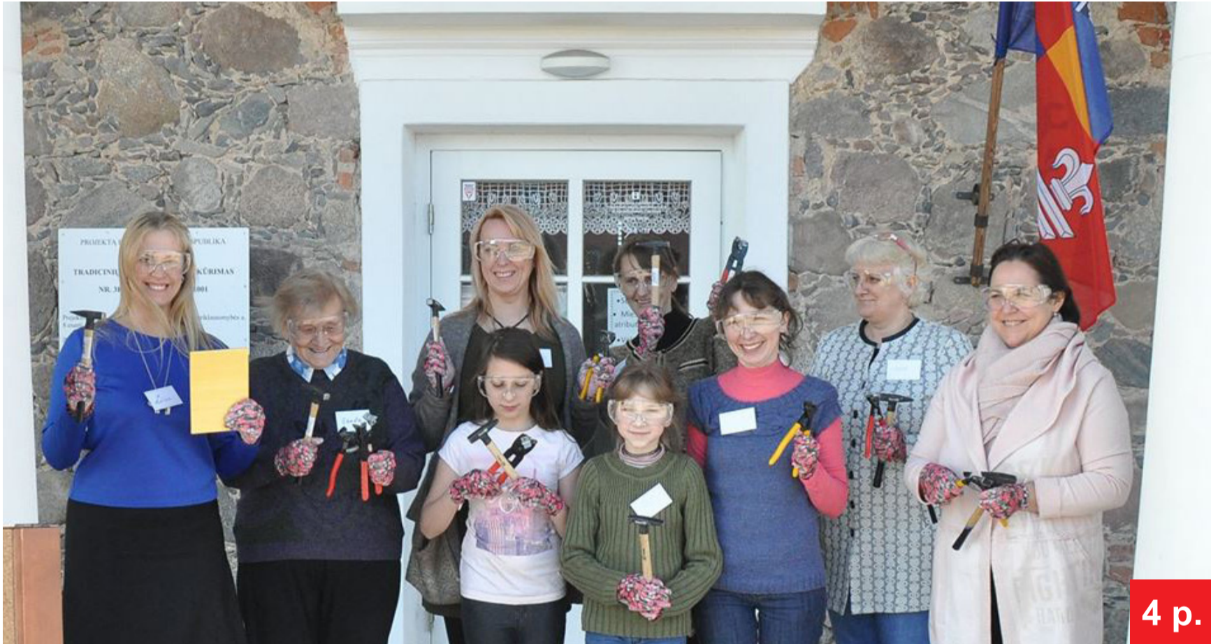
Projektas bendram darbui sutelkė vietos bendruomenes.