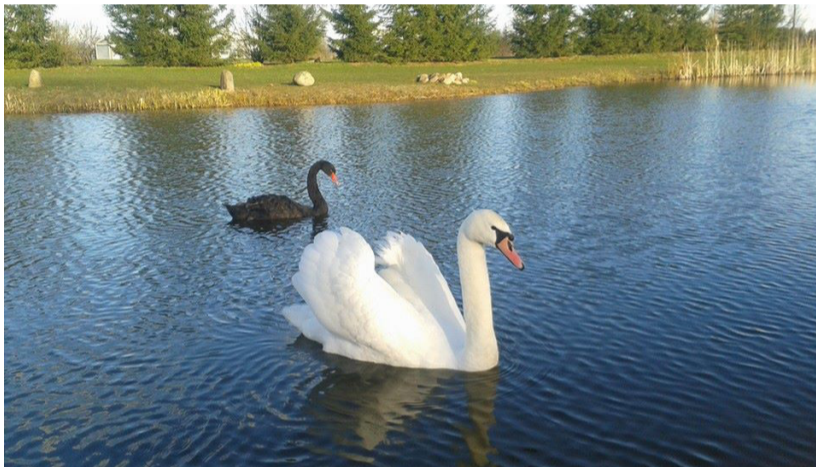
Likimo draugai Euras/-ė ir baltoji gulbė, tarsi sodybos šeimininkai.

„Juodosios gulbės jauniklis „susi-draugavo“ su baltąja gulbe. Pastarąją sužeistą mums atvežė žmonės“, – kalbėjo paukščius priglaudusi R. Juozapavi-