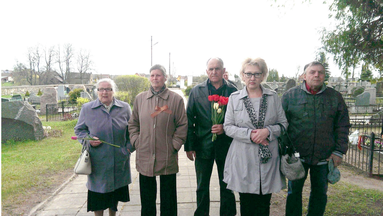
Ne visi, atėję pagerbti karių atminimo, ryšėjo „Georgijaus juosteles“, tačiau ir šiemet atėjusiems pagerbti sovietinių karių atminimo, jos buvo dalijamos.

Kaip ir ankstesniais metais, taip ir šiemet, kai kurie paminėjimo dalyviai į atlapus įsisegė vadinamąsias „Georgijaus juosteles“. Iš kur jos at-