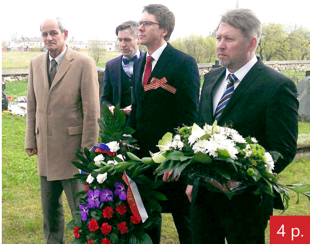
Iš oficialių asmenų, atėjusių pagerbti Antrojo pasaulinio karo aukų atminimą, „koloradinę“ juostelę ryšėjo tik Rusijos Federacijos ambasados atstovas.