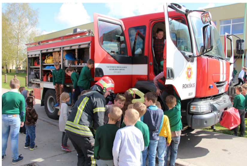
Ugniagesių technika ypač sudomino mažuosius moksleivius.

Rokiškio Senamiesčio progimnazijos inform.