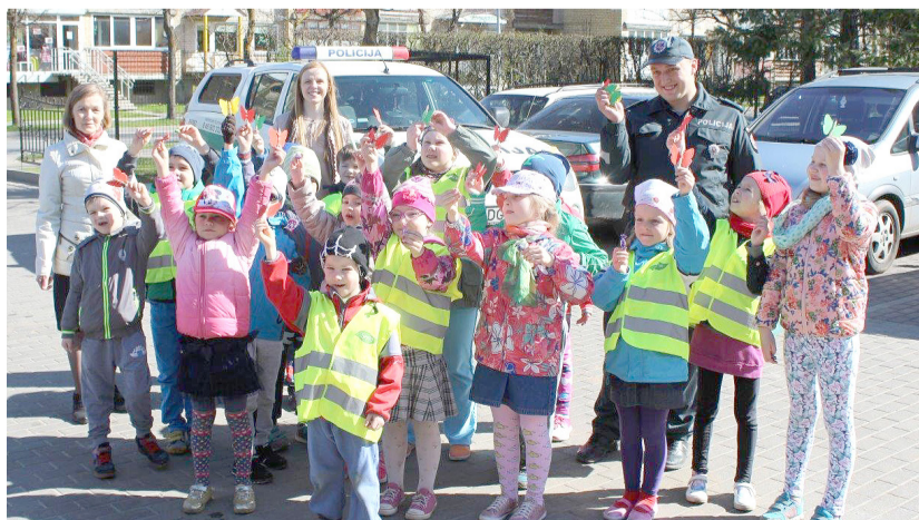
Mažieji eismo dalyviai ir jų auklėtojos įsiamžino su pareigūnais.