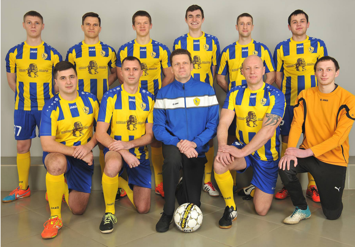
Rokiškio futbolo klubo komanda tiki: naujoji žaidėjų apranga bus sėkminga.

Daugiau klausimų nei atsakymų kelia ir naujoji Lietuvos futbolo federacijos kuriama mėgėjų licencijavimo sistema. Nors klubo žaidėjai jau seniai suregistruoti federacijos duomenų bazėse. Daugiausia klausimų kelia mintis, kad mėgėjas ga-